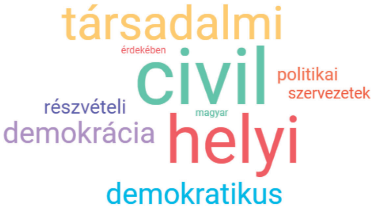
1. ábra. Kódolt szöveg leggyakrabban használt szavai

A leggyakrabban kódolt szó a „civil”, amely valószínűleg azért végzett első helyen, mert nem csak a tanácskozás-, a részvétel-kódnak is szerves részét képezi a pártok civilekkel való kapcsolata, nekik tett ígéreteik. A „civil” szót előfordulásának legnagyobb részében a „szervezetek”, „szféra”, „világ” szavak követik, emellett jellemző még a „kezdeményezés”, amely arra utal, hogyan segítené a civil kezdeményezések felkarolását az adott párt. Ennek lehetséges oka, hogy a tanácskozásra vonatkozó ígéretnek nagy része a civil szervezetekkel, társadalommal való egyeztetéseket jelenti, ezzel az eredmények értékelésénél részletesebben is foglalkozunk.