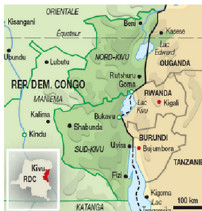
1. sz. térkép: Észak- és Dél-Kivu tartomány a szomszédos országokkal

Az ENSZ erők is jelentős támogatást nyújtottak a FARDC-nek, de a végső fordulatot az Addis-Abeba 14 -i döntés eredményeként, a három Afrikai Unió tagország (Dél-Afrika, Tanzánia és Malawi) által felajánlott katonai erőkből létrehozott Intervenció dandár megalakítása és tevőleges harctevékenysége hozott a kongói hadsereg oldalán. Emellett azonban a nemzetközi politikai is rendkívül aktív szerepet játszott az egyre súlyosbodó helyzet megoldásában.