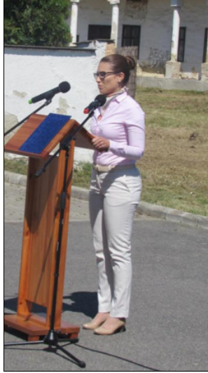
Illés Boglárka helyettes államtitkár