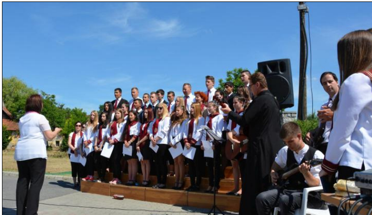
A középiskola énekara