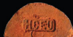
64. kép: MM' HCEU féltér - Herceg Coburg Edeleány Uradalma, LH: Edeleány, leg. Lakt-Lukács L. & Török L. coll. Török L.