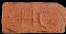
59. kép: D' HC féltér - Herceg Coburg, LH: Edeleány, leg. Lakt-Lukács L. & Török L. coll. Török L.