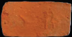
69. kép: D' RS féltér - Schüller & Reich, LH: Edeleány, leg. Lakt-Lukács L. & Török L. coll. Török L.