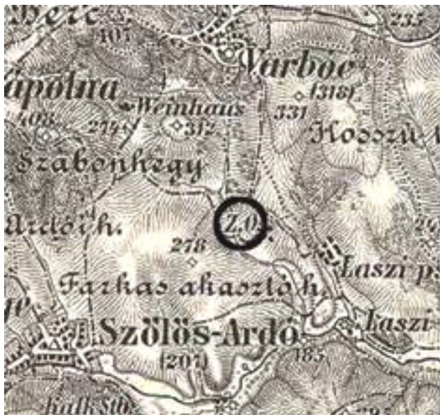
3. ábra: A Gedeon-féle tégláégető Lászi pusztán a III. katonai felmérés térképén