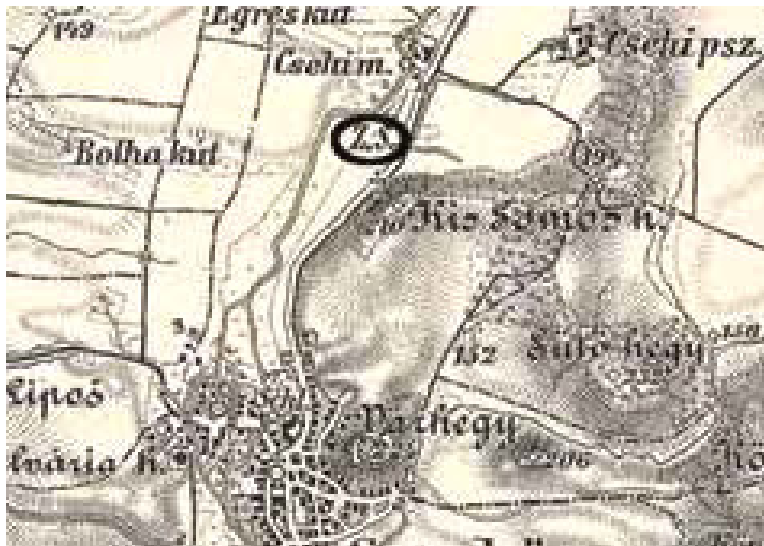
8. ábra: A szendrői téglavető a III. katonai felmérés térképén

A téglák készítése valószínűleg a 3. katonai felmérés térképén a Szalonna felé vezető út mellett, a Csehi malomnál jelzett téglavető volt. (8. ábra) A városban az itt gyártott téglák mellett jelentős számban lehet találni más településeken készített és később ideszállított téglákat is. A környező Edelényből, Szendrőládból származó téglák mellett találtunk miskolci söt katymári téglát is.