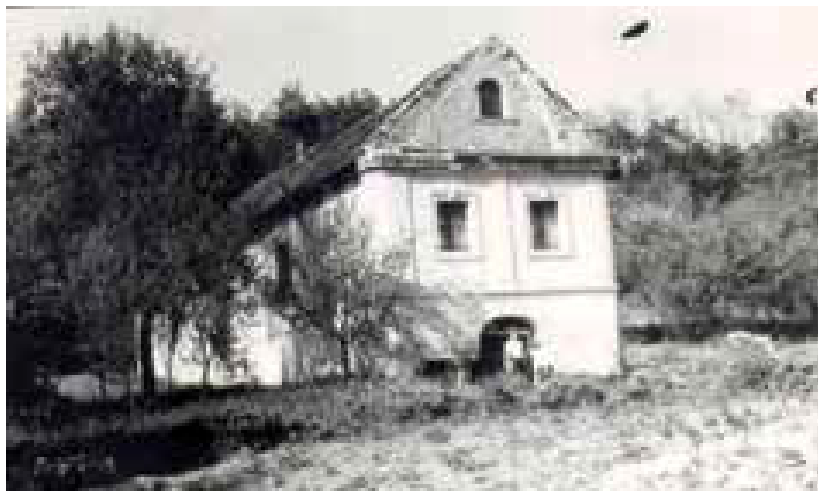
13. ábra: A mogorósi viccellérház (1988)

A téглаégető mellett több szénbánya is volt. E mellett itt laktak a téglagyári munkások és a bányászok is. Barlanglakásokban, illetve kő és téгла vegyes felhasználásával készült házakban. Az edelényi római katolikus anyakönyvben az alábbi téglások szerepelnek: