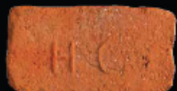
57. kép: D' HC féltér - Herceg Coburg, LH: Edeleány, leg. Lakt-Lukács L. & Török L. coll. Török L.