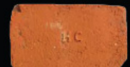
61. kép: D' HC féltér - Herceg Coburg, LH: Edeleány, leg. Lakt-Lukács L. & Török L. coll. Török L.