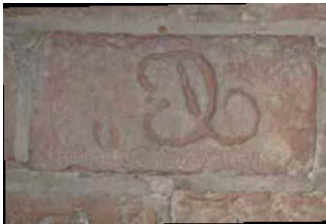
7. ábra: Visszaépített téglát a szalonnai református templom padozatában

Visszatérve az országos főútra Szendrő felé álljunk meg néhány pillanatra Szalonnán , a református templomnál. Első templomát a XII. században Tekus bán építette. Melyet a századok során többször is átalakítottak, bővítettek. Az 1970-es évek elején az egész templomot felújították. Ennek keretében a szentély padlóját lesüllyesztették az eredeti szintjére, illetve az ott talált téglákat visszaépítették bele. Jelenleg a padozatban négy darab pecsétetes téglát látható. Ezek közül a legjobban kivehető mintázatút a 7. ábra mutatja. (Az oldalfalon két darab, Perkupánál említett CP jelű téglát is beépítésre került.)