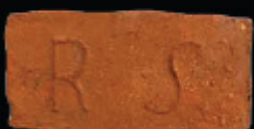
66. kép: D' RS féltér - Schüller & Reich, LH: Edeleány, leg. Lakt-Lukács L. & Török L. coll. Török L.