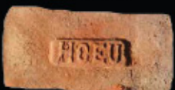
63. kép: MM' HCEU féltér - Herceg Coburg Edeleány Uradalma, LH: Edeleány, leg. Lakt-Lukács L. & Török L. coll. Török L.