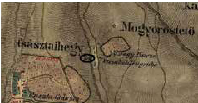
11. ábra: Az edelényi téglagödő a II. katonai felmérés térképén