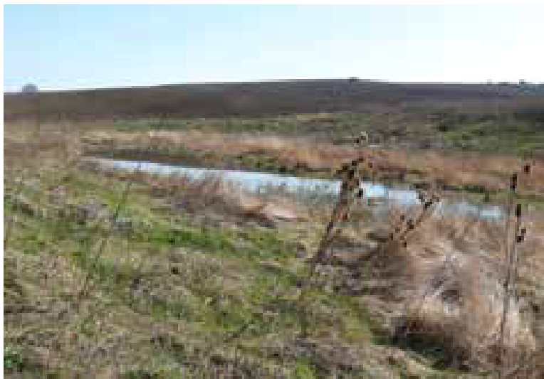
10. ábra: A volt Almásy tanya téglagödre napjainkban