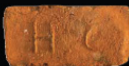
56. kép: D' HC féltér - Herceg Coburg, LH: Edeleány, leg. Lakt-Lukács L. & Török L. coll. Török L.