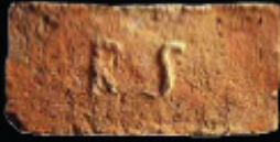
71a. kép: D' RS féltér - Schüller & Reich, LH: Edeleány, leg. Lakt-Lukács L. & Török L. coll. Török L.