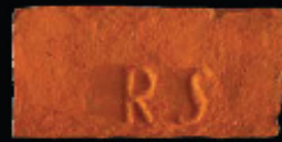
70. kép: D' RS féltér - Schüller & Reich, LH: Edeleány, leg. Lakt-Lukács L. & Török L. coll. Török L.