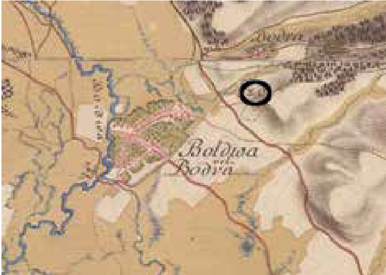
16. ábra: Boldva tégláégetője az I. katonai felmérés térképén