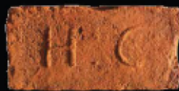
58. kép: D' HC féltér - Herceg Coburg, LH: Edeleány, leg. Lakt-Lukács L. & Török L. coll. Török L.