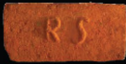
71. kép: D' RS féltér - Schüller & Reich, LH: Edeleány, leg. Lakt-Lukács L. & Török L. coll. Török L.