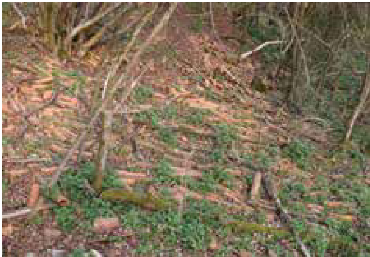
6. ábra: Alagsó maradványok a Lászi pusztai égető területén