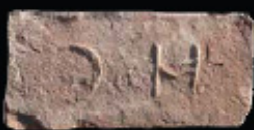
60. kép: D' előlét HC féltér - Herceg Coburg, LH: Edeleány, leg. Lakt-Lukács L. & Török L. coll. Török L.