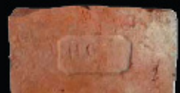
62. kép: MD' HC féltér - Herceg Coburg, LH: Edeleány, leg. Lakt-Lukács L. & Török L. coll. Török L.