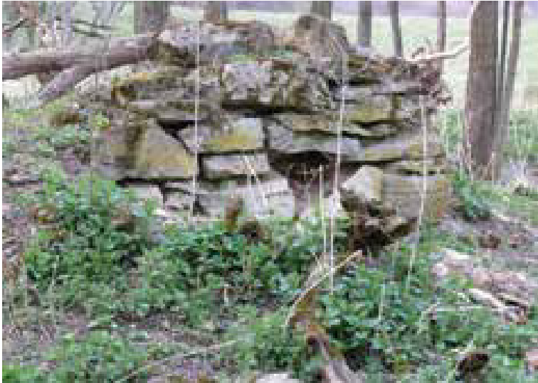
5. ábra: A tégláégető romjai Lászi pusztán