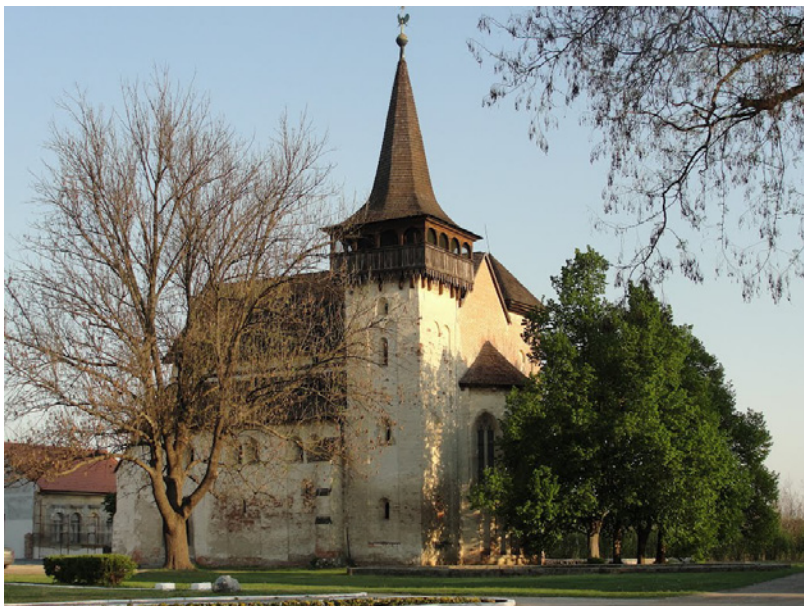
15. ábra: A boldvai református templom

Boldvától délre a Bódva beleömlik a Sajóba, ami a Bódva-völgy és utunk végét jelenti.