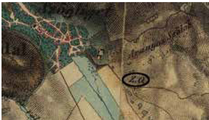
2. ábra: A Szádvári Uradalom tégláégetője a II. katonai felmérés térképén

Utunk következő állomása Bódvaszilas , mely már a jelenlegi Magyarország területén található. A XVIII. században a település földesura az Eszterházy család volt, annak is a hercegi ága. Bódvaszilas kezdetben a szögligeti uradalom része, majd annak központja. Földesura, Esterházy Miklós herceg itt kis kastélyt és hatalmas méretű magtárat építtet. A kastély viszont csak a hercegi intéző szállásául szolgált. Maga a herceg, illetve annak családja – tudomásunk szerint – nem szállt meg benne. A kastély építésénél használt téglát a 6. képen láthatjuk. Az uradalom távol esett a főleg északnyugat Magyarországon található Esterházy birtokoktól, így már a XIX. század elején bérbe adás útján hasznosították. Bérelője Anton Burger volt, akinek téglája a 7. képen látható. Az Esterházy, s így az Anton Burger féle téglák gyártási helye is nagy valószínűséggel a 2. katonai felmérés térképén a Szögligettől délkeletre, az Aranyos Szőlők nevezetű dűlő alatt jelzett tégláégető volt. (2. ábra)