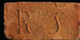
67. kép: D' RS féltér - Schüller & Reich, LH: Edeleány, leg. Lakt-Lukács L. & Török L. coll. Török L.