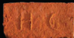
55. kép: D' HC féltér - Herceg Coburg, LH: Edeleány, leg. Lakt-Lukács L. & Török L. coll. Török L.