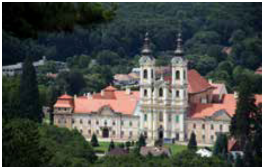
1. ábra A jászói apátság épületegyüttese.

Utunk első állomása Jászó (szlovákul: Jasov). A kisváros történetét és mai arculatát meghatározza az, hogy itt található a Premontrei Prépostság központja. A lenyűgöző templom a hozzá tartozó apátsági épületegyüttessel (1. ábra) tekintélyt parancsolva uralja a város központját, miközben úgy mesél gazdáinak több száz éves történetéről, hogy közben sejteti annak gazdasági hatalmát is.