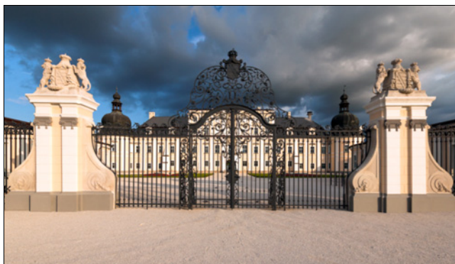
A felújított kastély északról.

(Részlet az Edelényi hétköznapiak a 18. században című könyvből. Szerk.: Krász Lilla – Kurucz György. Forster Gyula Nemzeti Örökséggazdálkodási és Szolgáltatási Központ. Budapest, 2014. 20-22. p.)