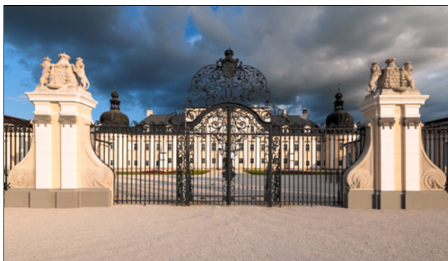
A felújított kastély északról.

(Részlet az Edelényi hétköznapiak a 18. században című könyvből. Szerk.: Krász Lilla – Kurucz György. Forster Gyula Nemzeti Örökséggazdálkodási és Szolgáltatási Központ. Budapest, 2014. 20-22. p.)