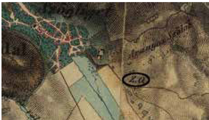
2. ábra: A Szádvári Uradalom téglaegetője a II. katonai felmérés térképén