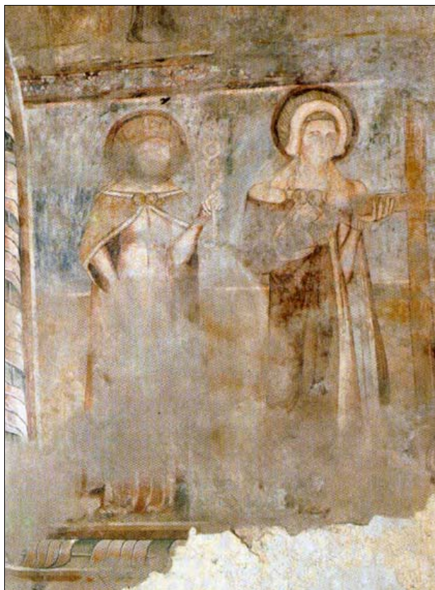
A Szent Kereszt megtalálása (freskórészlet).