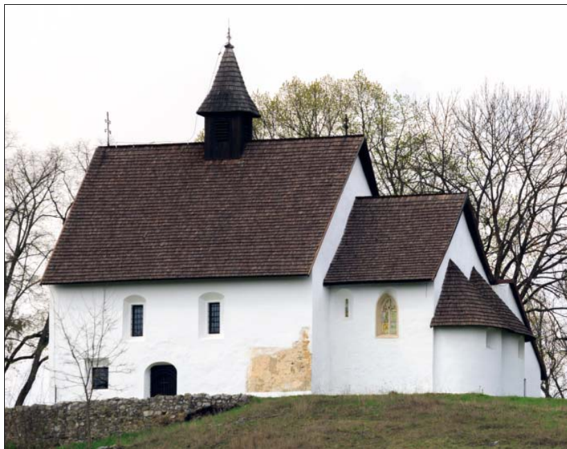
A tornaszentandrási római katolikus templom.

De vajon honnan származik a ritka alaprajzi elrendezés?