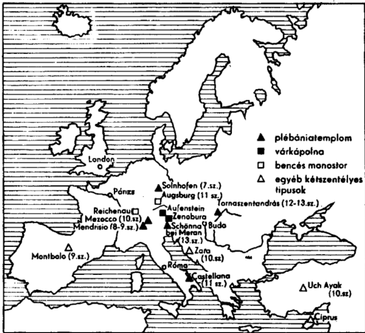
Ikerszentélyes templomok Európában.

Ezek a szerzetesi és plébániatemplomok közel vannak egymáshoz olyan területen, ahol a VII-VIII. században frank fennhatóság alatt germán törzsek éltek. Ők abban az időben vették fel a keresztiséget. 771-től Nagy Károly uralkodott a frankok felett, s negyvenhat évi szívós munkával megeremtette a Karolingok világbirodalmát, melybe Franciaországtól Pannóniáig Egész Európa beletartozott. A Karoling birodalom támaszt talált a megerősödött egyházban, ám nagyságát, hatalmát minden téren igyekezett kifejezni. Az újabb egyháztörténeti kutatások szerint az ikerszentélyes templomtípus határozottan Karoling-sajátosság Európában, s a Karolingok birodalmi eszményének a sajátosra, különlegesre való törekvésével magyarázható.