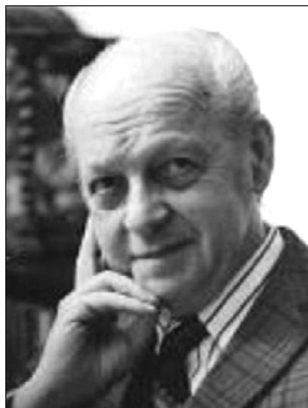
Gerő László a magyarországi tudományos várkutatót megalapítója

Gerő László építész korszakalkotó könyve, a „Magyarországi várépítézet” (1955) Szádvár esetében alig néhány falmaradványról szólt. Ebből látszik, hogy a hazai tudományos várkutatót megteremtő szakember nem járt ezen a helyszínen.