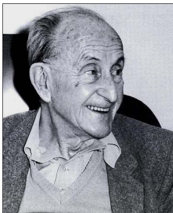
Détsky Mihály művészettörténész feldolgozta a várbeli inventáriumokat