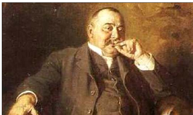
Mikszáth Kálmán Mátyás-kori legendát varázsolt Szádvár köré

Mikszáth Kálmán tollából 1890-ben került ki a „Magyar várak regéi” című mű, amiben Szádvárnak egy Hunyadi Mátyás királyhoz kapcsolódó mondájával ismerkedhetünk meg.