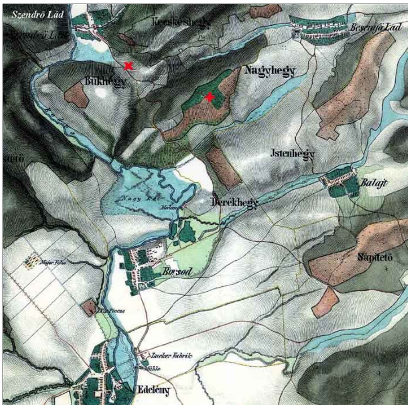
A terület ábrázolása a második katonai felmérés térképlapján. A piros X-ek az álláspontjainkat jelölik.

faluhoz értek, akkor tudták meg, hogy erre nem juthatnak tovább Kassa felé. A következő napot a hegyekkel körülvett völgyben töltötték. Vissza kellett volna térniük a szendrői útra, azonban a besenyői völgy kijáratát a Nagy-hegy, Isten-hegy vonalában lezárták Bocskai hadai. Mivel a szekerekkel csak erre lehetett kijutni a völgyből, Basta 27-én úgy döntött, hogy elégeti mind a 300 szekerét, valamint a lovon nem szállítható málhát. Valószínűleg a hegyeken keresztül akart utat keresni. Másnap hajnalban az időjárás a segítségére sietett. A besenyői völgyet megülő köd lehetőséget biztosított arra, hogy megközelítsék a kijáratot őrző török és magyar csapatokat. A képen azt láthatjuk, amikor a puskás dragoonosok lóháton rohanják meg a sánco-