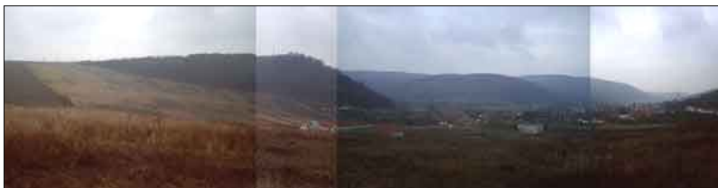
A szendrőládi völgy

Nézzük az eseményábrázolást! A császáriak a falu irányába támadnak, a dombtól lefelé. Ez azt jelenti, hogy Edelény felől, a dombgerincen keresztül törnek be a Bódva völgyébe. Figyelembe véve azt, hogy a császári seregek célja Kassa elérése volt, és a csata után közvetlenül elfoglalták Szendrőt, az irány megfelelő. Már csak az a kérdés, hogyan jutottak ide Ládbesenyőről.