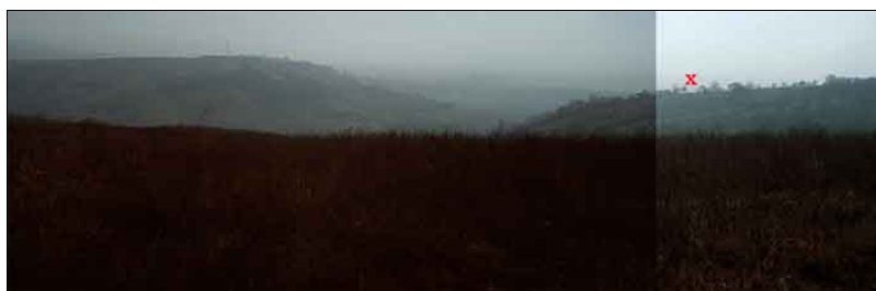
Zimmermann rézkarca és kilátás a művész egykori álláspontjáról. A piros X Borsodvár helyét jelöli