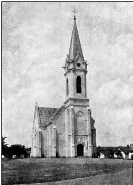
Erzsébet Királyné Fogadalmi Templom Edelényben. Nagy Géza: Első fogadalmi templom Erzsébet királyné emlékére című könyvből

„A kultuszok vallási eredete gyakran megmutatkozik. Erzsébet királyné esetében a szakrális vonulat nagy jelentőségű, ami leginkább a kiemelt színtereken, a templomokban figyelhető meg.