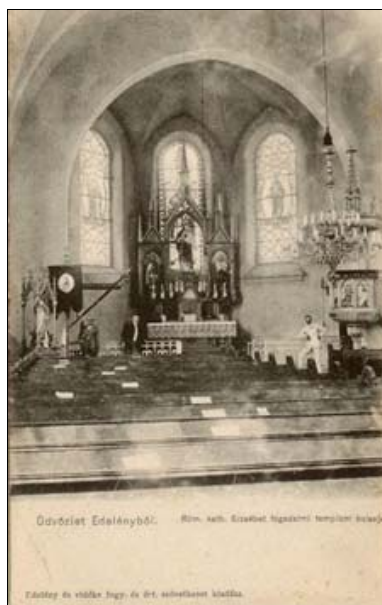
Ódvolet Edelenyből. Róm. kath. Szűz Mária tiszteletére szentelt templom belsője.

Edeleny és vidéke Nagy- és Kis-székelyországi községei.