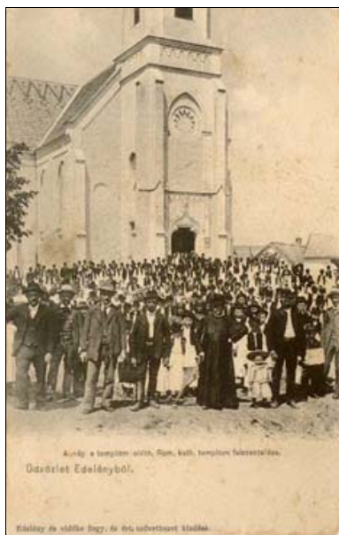
Aratók a templom előtt, Róm. kath. templom falczellája. Ódvolet Edelenyből.

Edeleny és vidéke Nagy- és Kis-székelyországi községei.