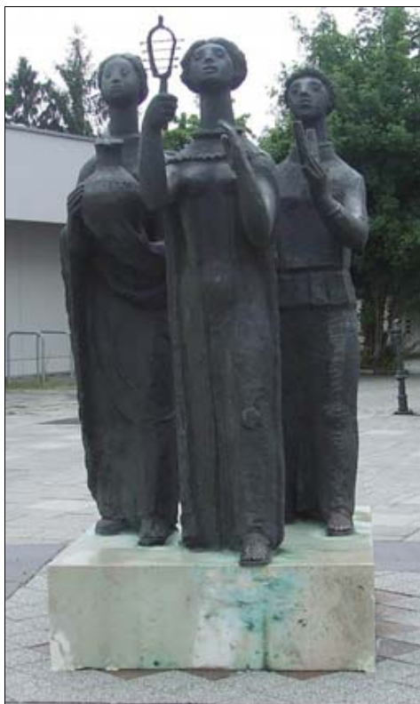
Ünnepi menet Ízisz tiszteletére (Szombathely, 1980)

A mérnöki szilárdságú szerkezet szigorúságát elrejtí a felületek érzékletes mintázása ... Időben és szellemében távoli világot idéz ez a mű, mégis minden ízében mai.”