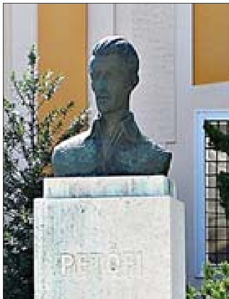
Petőfi Sándor (Sárvár, 1948)

Két jelentős tevékenységéről feltétlenül szólni kell. A Berzsényi Dániel Tanárképző Főiskola irodalmi és tudományos ifjúsági lapjának, a „Jelentkezünk”-nek alapítója, szervezője és első szerkesztője volt, megjelenési lehetőséget adva számos fiatal tehetségnek. A lap máig él, létezik.