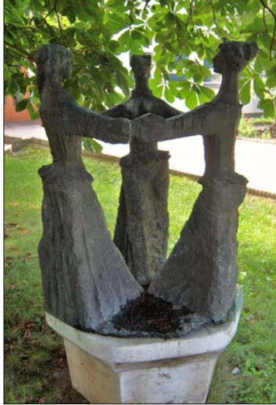
Körtánc (Szombathely, 1986)