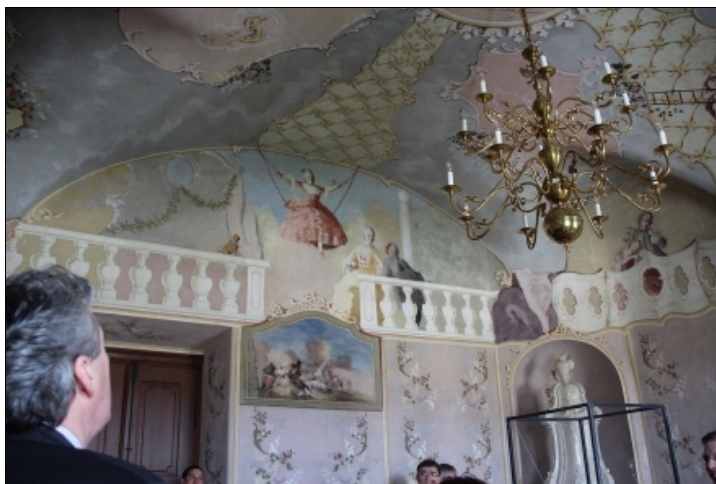
Freskórészlet az étkezőből.

Az 1716 és 1730 között épült kastély egyedülálló módon ötvözte a kor divatjának megfelelően a francia és itáliai barokk stíluselemeket a 17. századi magyar kastélyépítészeti tradíciókkal, mely leginkább a saroktornyok kialakításában érzékelhető. A kastély különleges éke, a Lieb Ferenc iglói vándorfestő keze munkáját dicsérő, Magyarország legnagyobb, összefüggő rokokó falképegyüttese, mely L’Huillier unokája, Forgách Ludmilla grófnő és második férje, Eszterházy István gróf megrendelésére 1770-re készült el. A korszak közkedvelt témáit, a zsánerképeket, virágdíszítésű ornamentikát felvonultató, valamint az ókori világ, és a főúri élet legjellemzőbb jeleneteit megidéző, szinte ezer négyzetméternyi festett falfelületen 12 restaurátor dolgozott több mint másfél évig az edelényi Kastélybarátok Köre által összegyűjtött archív fotódokumentáció felhasználásával.