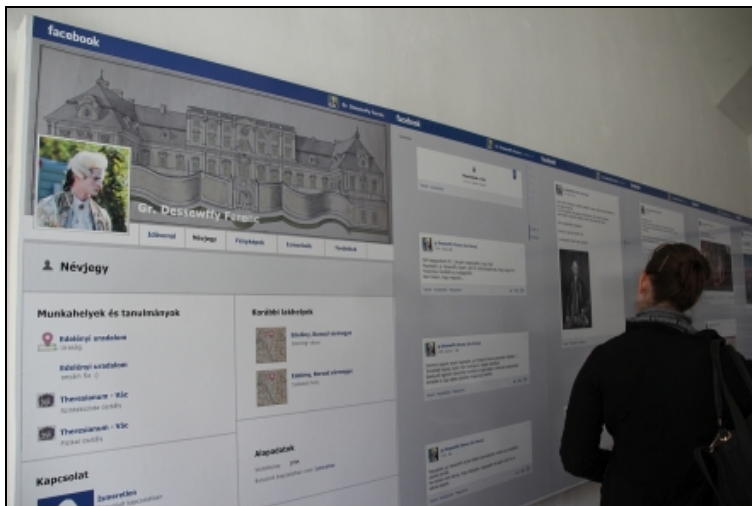
Kiállításrészlet.