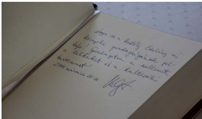
Balog Zoltán, az emberi erőforrások minisztere bejegyzése a vendégkönyvben.

Magyarország hetedik legnagyobb kastélya a magyar kastélysorok körében már jól ismert kálváriák és drasztikus funkcióváltások után visszanyerte eredeti, 18. századi pompáját. Az épületet Balog Zoltán , az emberi erőforrások minisztere adta át, és fotósok által körülvéve a kastély vendégkönyvébe egy kedves bejegyzést írt: „Legyen ez a kastély Edelény és környéke gazdagságának jelképe! Gazdagítsa a szellemet, a lelkeket és a kulturális turizmust! 2014. március 26-27.”