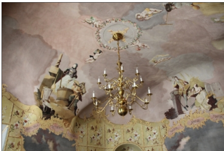
A négy évszak terme. Freskórészlet.

A felújítási munkák látványos eredményéhez jelentős mértékben hozzájárult a kastély épülettörténetét, lakóinak életmódját, mindennapi életét mélységeiben is feltáró tudományos kutatási program, amely annak a múzeumpedagógiai koncepciónak is alapját képezi, amelynek célja volt, hogy az Edelényi kastélyszigetet minden korosztály számára élményszerűen tudják bemutatni.