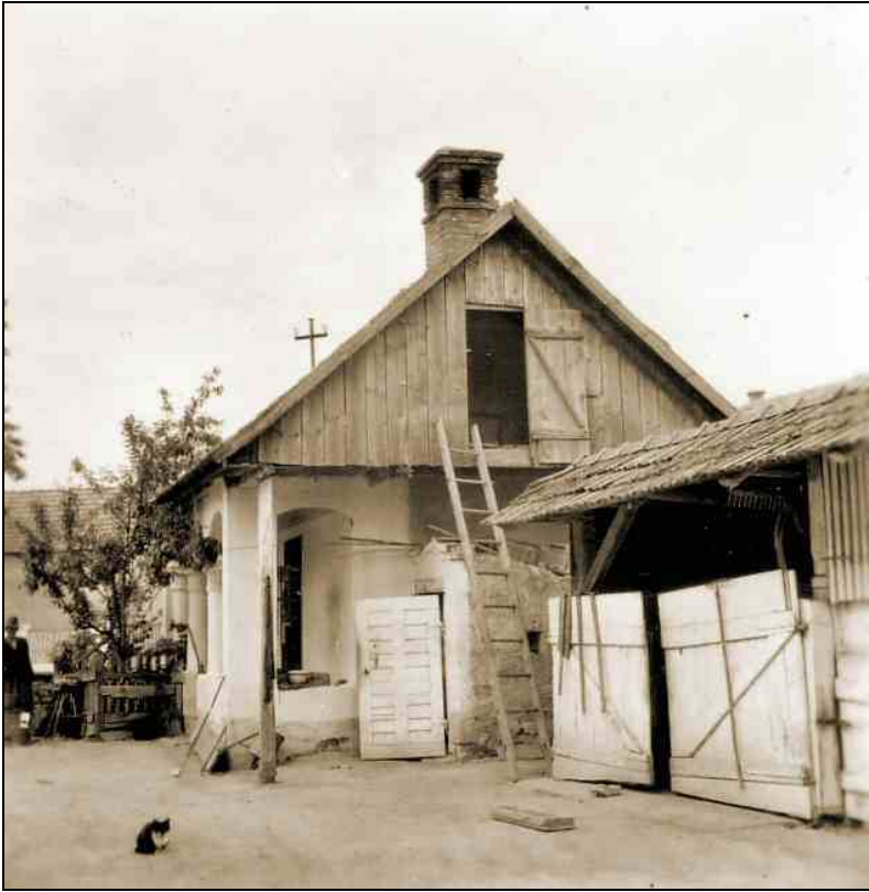
Sztálin út 223., nyári konyha (Borsodi Tájház, Szathmáry-Horkai Ház, ma Borsodi út 155.)