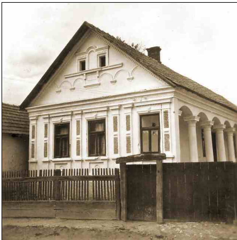
József Attila u. 8., homlokzat (ma Borsodi Tájház, Vadászy ház, Váralja u. 3.)