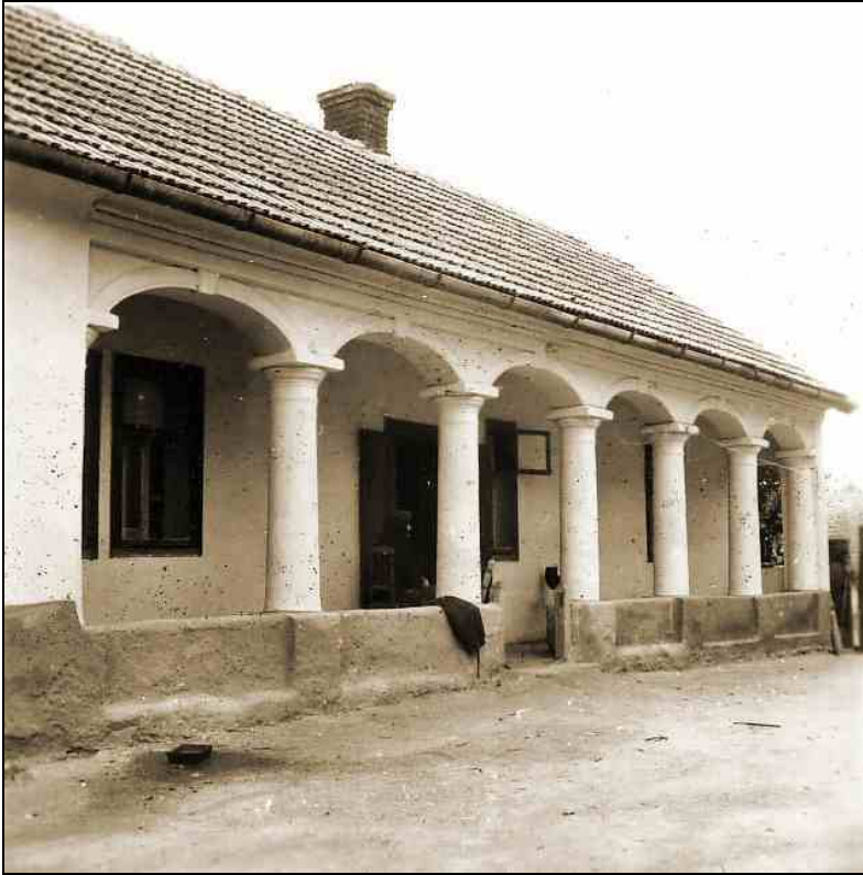
Bors vezér út 2.