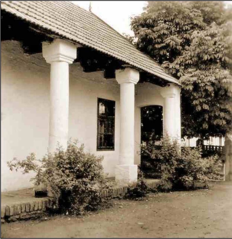
Sztálin út 260.