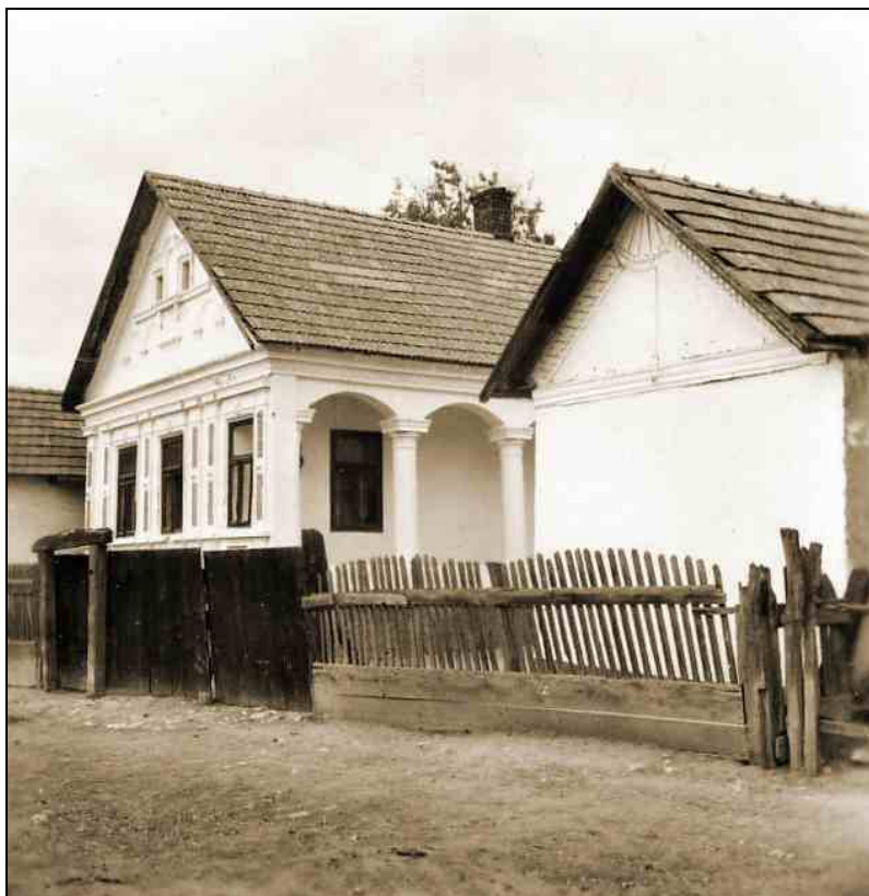
József Attila u. 8. (ma Borsodi Tájház, Vadászy ház, Váralja u. 3.) Mellette a nyári konyha, amely le lett bontva