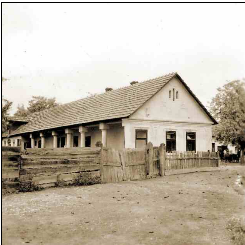
Sztálin út 256.