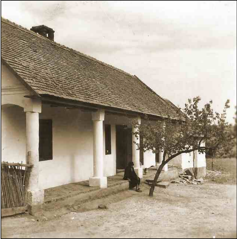
Bors vezér út 3.