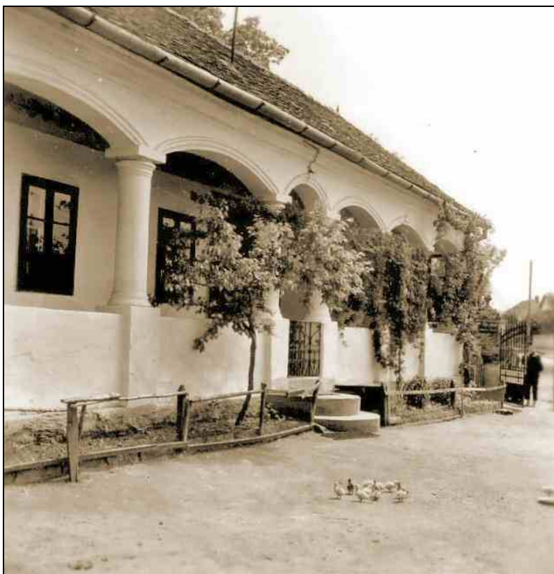
Sztálin út 223., tornác (Borsodi Tájház, Szathmáry-Horkai Ház, ma Borsodi út 155.)