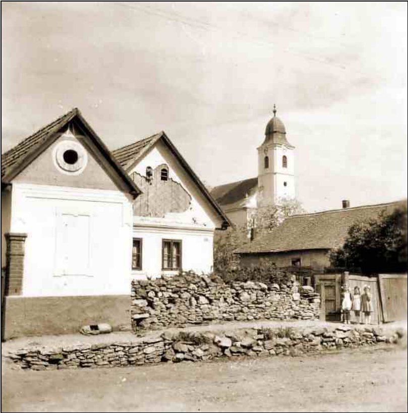
Sztálin út 203-209., háttérben a református templom