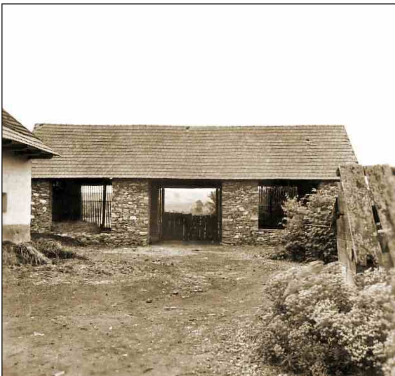
Sztálin út 183., csűr (ma Borsodi út)