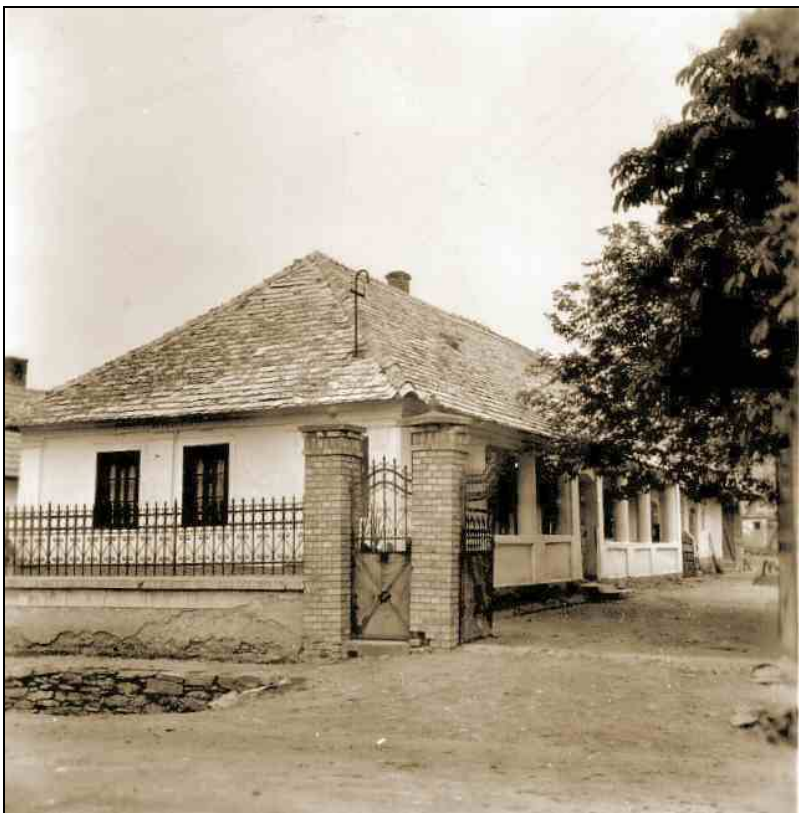
Sztálin út 211., homlokzat