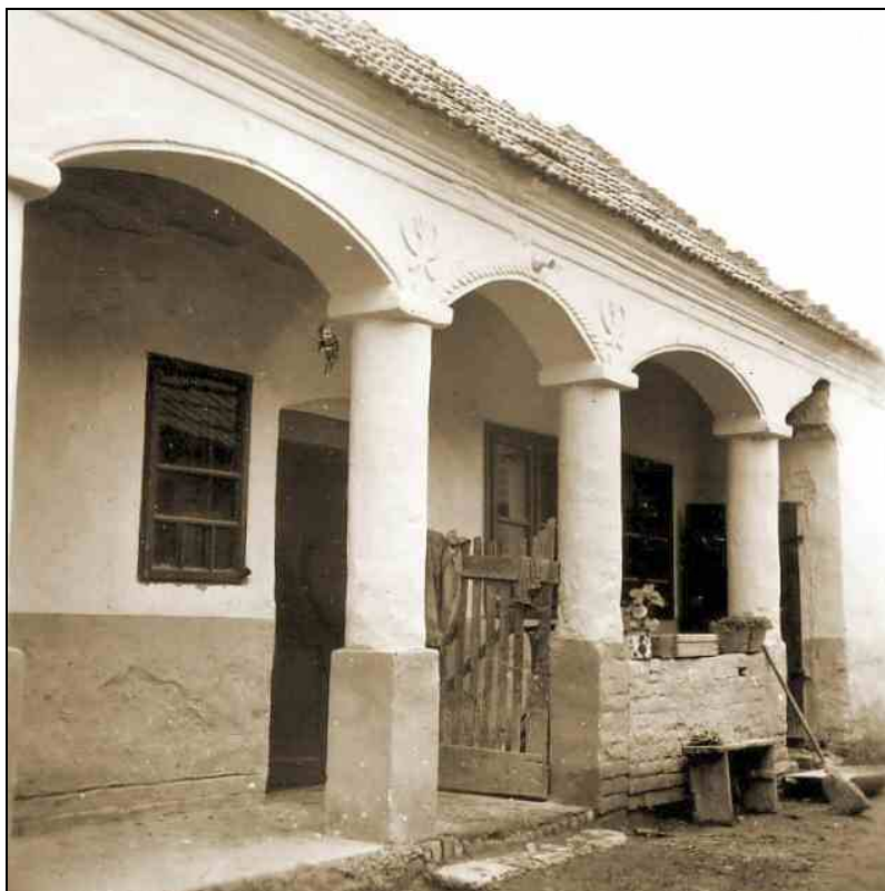
Sztálin út 185.