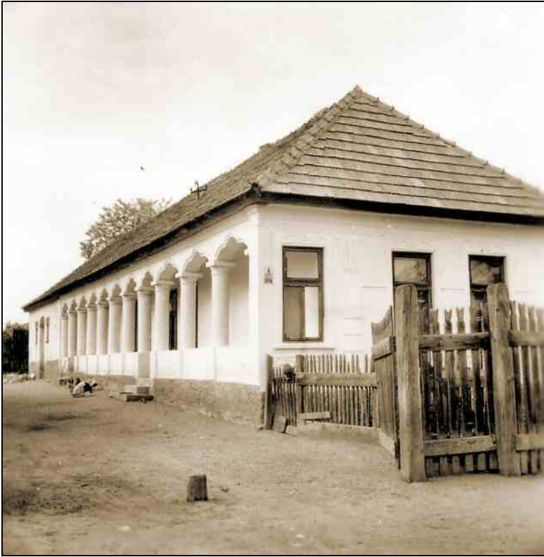
Sztálin út 254.