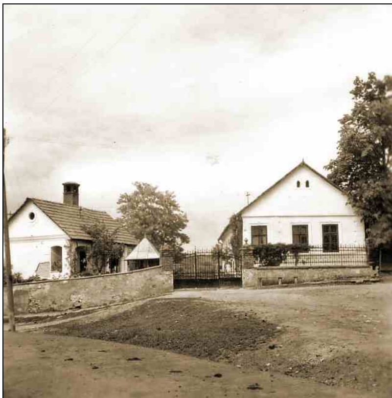
Sztálin út 223. (Borsodi Tájház, Szathmáry-Horkai Ház, ma Borsodi út 155.)