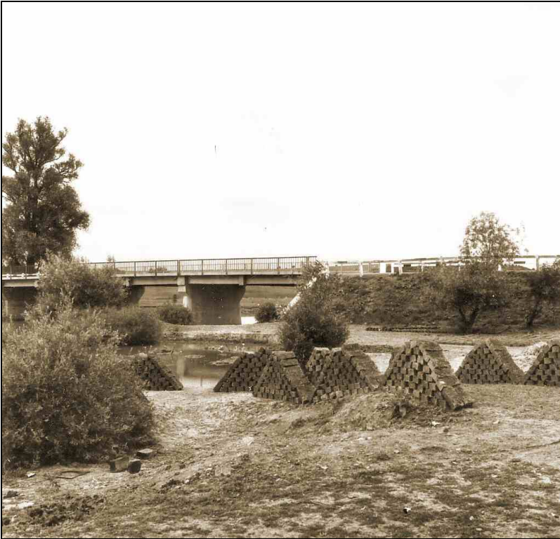
Száradó vályogtéglák a Bódva parton

A korabeli házszámok nem azonosak a mai házszámokkal.