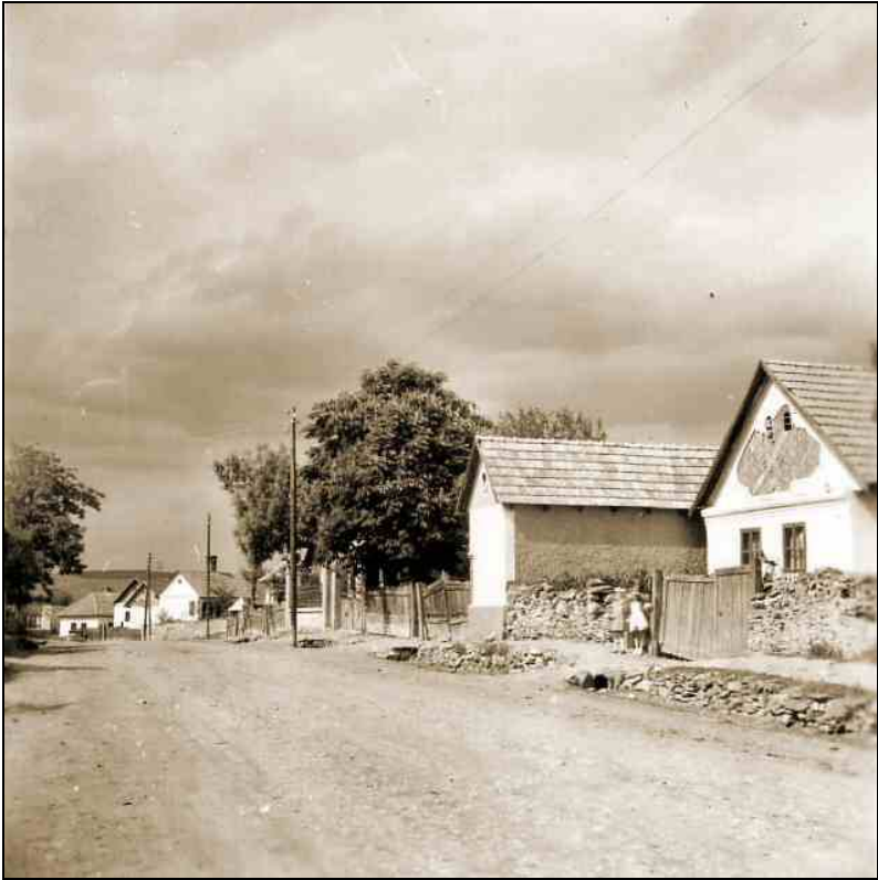
Sztálin út 203-209.