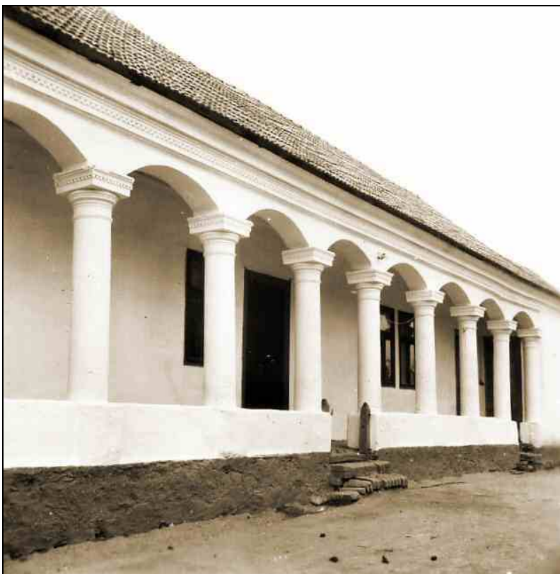
József Attila u. 8., tornác (ma Borsodi Tájház, Vadászy ház, Váralja u. 3.)