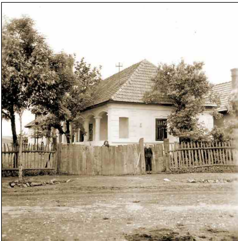
Sztálin út 248.