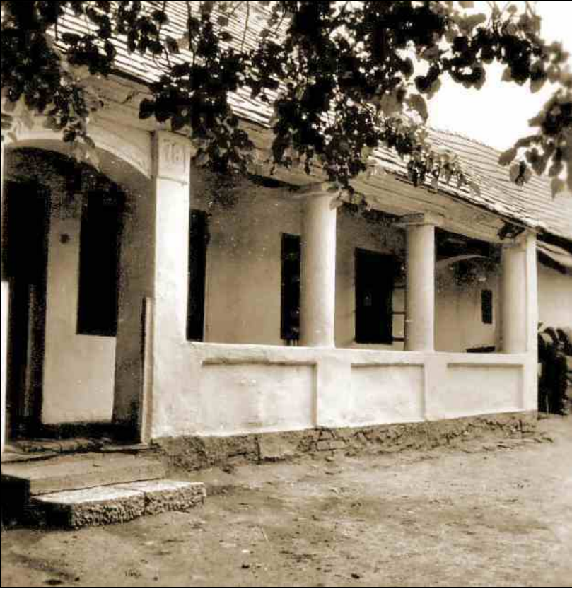
Sztálin út 211., tornác