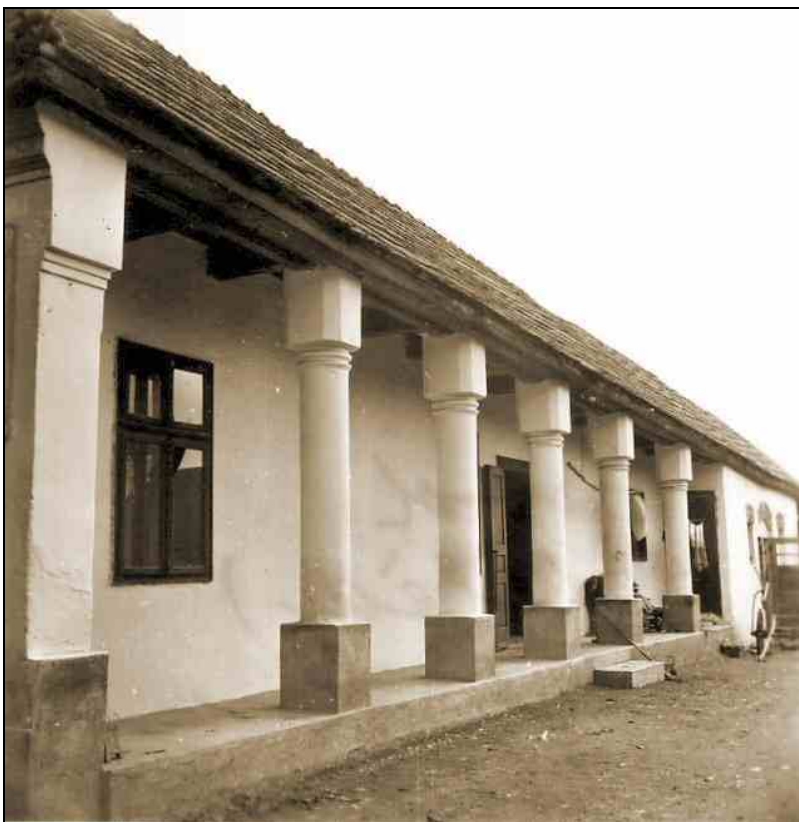
Sztálin út 187.