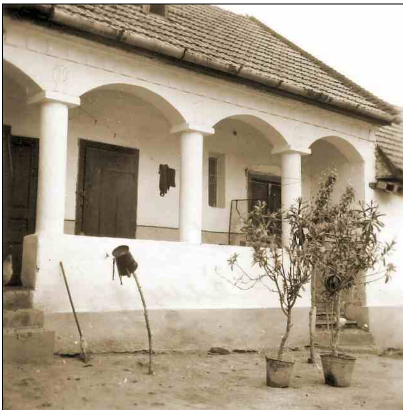
Sztálin út 197.