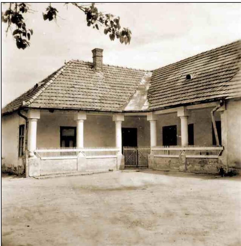
Sztálin út 262.