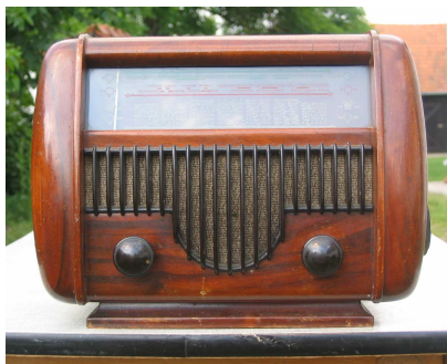
ORION 222-es; (1951)

A gyűjtemény nyitott: érdekesebb és ritkább készülékek megszerzése esetén átalakítható, kiegészíthető, az időben kitágítható. Elhatározásunk, hogy készülékeink egy részét csereszabatos új alkatrészek beépítésével restauráltjuk. A megjavított, biztonságosan működő rádiókat reményeink szerint kedves látogatóink 2006-tól már bizvást maguk is kipróbálhatják.