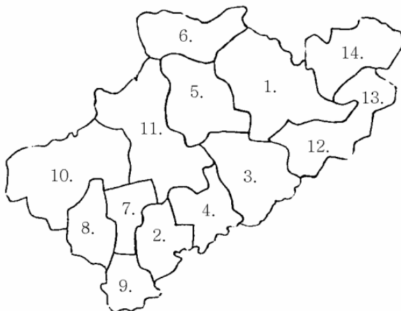
A rozsnyói egyházmegye esperesi kerületei