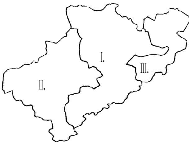
A rozsnyói egyházmegye főesperesi kerületei