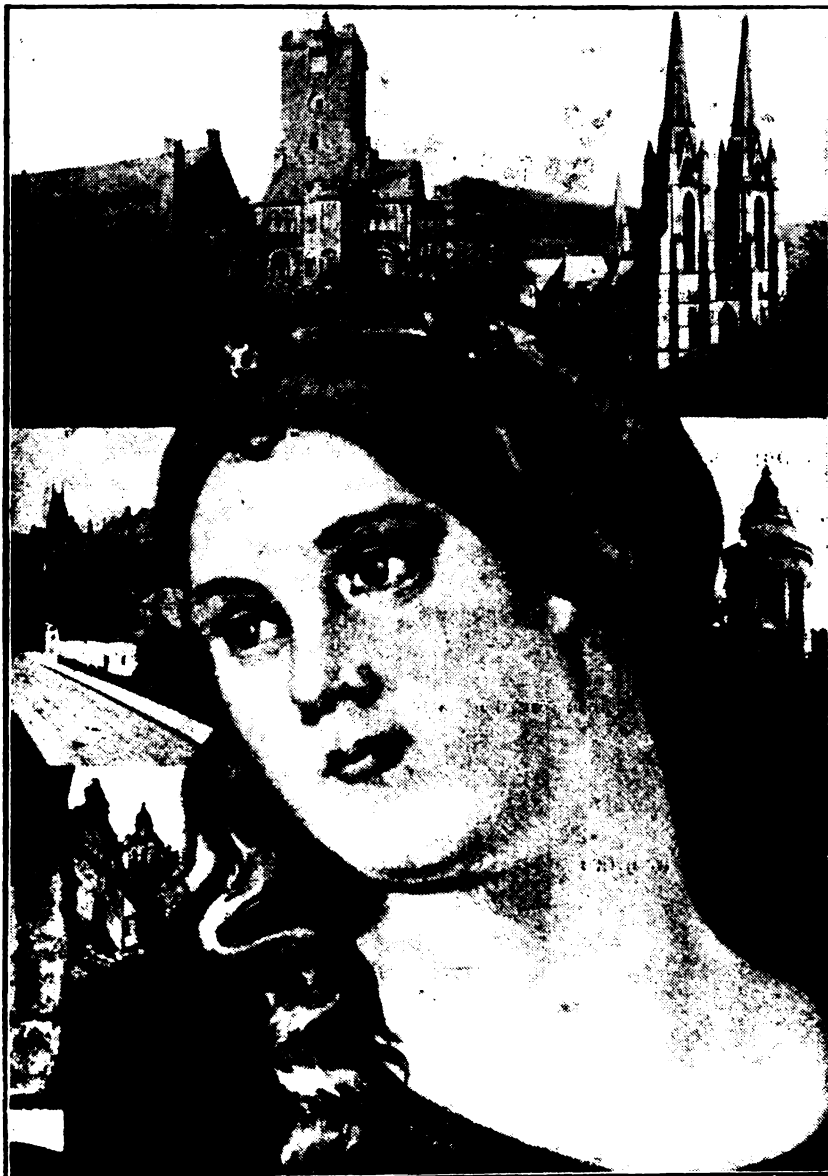
Árpádházi Szent Erzsébet könyörögj érettünk!