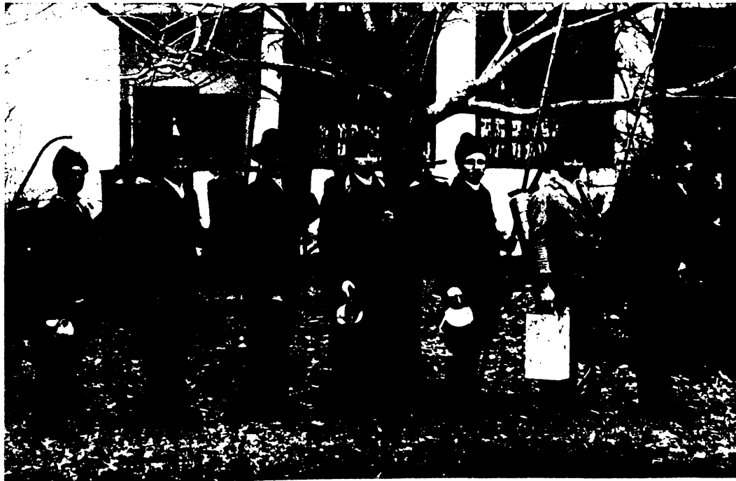
Munkába indulás előtt.

Minden kezdet nehéz. De került a községben pár, a fát és gyümölcsöt szerető kiscgazda, kik egy