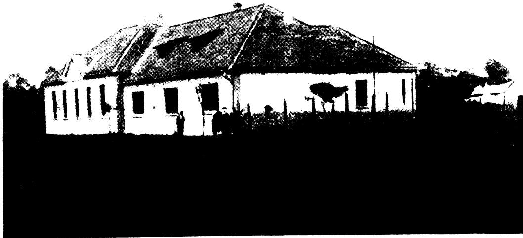
Az iskola épülete.

A forradalom elültével, 1920. esztendőben a régi alapokon folytatódott az építkezés, de már erősen redukált terjedelemben és szükségmegol-