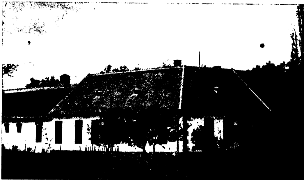
Az iskola főépülete.

Az iskola gyakorlóterületén először csak egy tanterem és egy munkaterem épült fel a fiúk részére, míg a lányok a községben bérelt helyiségben nyertek 1926-ig oktatást, mikor részint államsegéllyel, részint pedig a