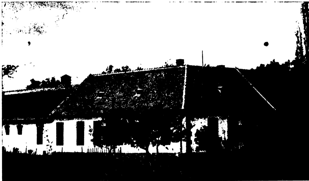
Az iskola főépülete.

Az iskola gyakorlóterületén először csak egy tanterem és egy munkaterem épült fel a fiúk részére, míg a lányok a községben bérelt helyiségben nyertek 1926-ig oktatást, mikor részint államsegéllyel, részint pedig a