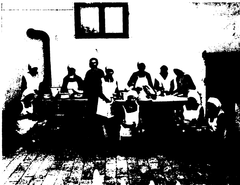
Háztartási tanfolyam 12—15 éves növendékei.

külön háztartási-, szabás-varrási-, vászon- és szőnyegszövő-, rózsza- és gyümölcsfaoltó tanfolyamokat tart, ahol az elméletben tanultakat gyakorlati ismeretekkel rögzítik meg és egészítik ki a növendékek.