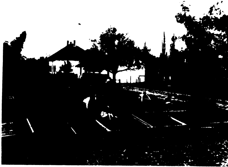
Leányok a melegágyak 1 kezelésénél.

sák. Szép példát látunk erre a kisujszállási iskolánál, ahol a leánynövendékek oktatása s a gyakorlati életre való nevelése valóban elismerésre méltó módon történik. Bemutatunk olvasóinknak néhány fényképfelvételt, melyek ezen iskolánál a gyakorlati oktatás egy-egy mozzanatát mutatják.