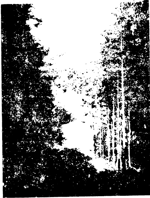
Tájkép az egri Bükkből.