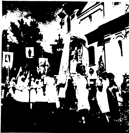
Mária-lányok a szentkúti Máriával.

szönnék, hogy a Mária-lányok viszik vállukon a szobrot három lépést előre és három lépést hátra. A falvakon átvonuló búcsúsokat fogadják, keresztjüket megcsókolják, haragszó kíséri a nagyobb csoportokat, fogadja a kegyhelyen a megérkezőket. Ha a kegyhelyen már van oly csoport, amely az u. n. Szentkúti Máriával jött a búcsúra, eléje megy a hordozható Máriával érkező búcsúnak s a két Mária-szobor is köszönti egy-