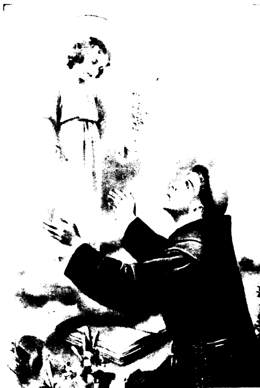
A kis Jézus barátja.

Áldott kezétől betegek erősödtek új küzdelmekre. Lélek-bénák izmosodtak a Keskeny Ösvény vándorlásaira. Gerinctelen pipotyák váltak sudártartású szentekké. Gyáva anyámasszony-