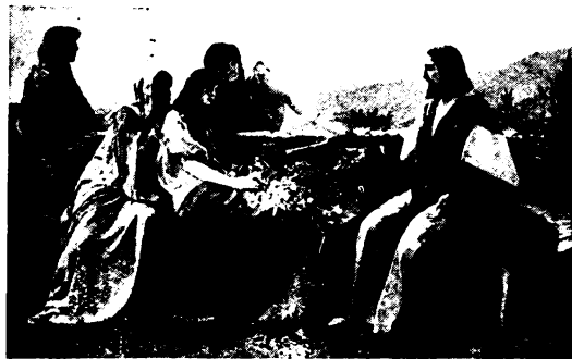
Lélek az Isten, és azoknak, akik Őt imádják, lélekben és igazságban kell imádniok. (Ján. 4, 24.)

Valahogy így vagyunk a lélek harcával is. Itt is minden változó, semmi sem állandó a lelken és a harcon kívül. Aki jól akar harcolni, aki győzni akar, annak százz szeműnek és mindent