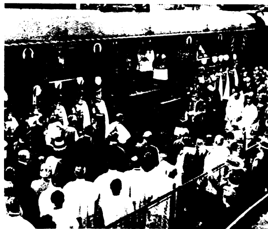
Még a Szent Jobb is zárandokolva járta az országot.