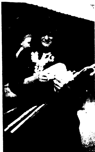
Minden unokának egy-egy mézesbábos rózsafüzért vett a nagynyó.

az egész község kivonul a hazaérkező zarándokok elé, s mennek a pappal együtt a templomba. Ugy énekelnek, mintha mindannyian a szent helyen lettek volna. Ugy