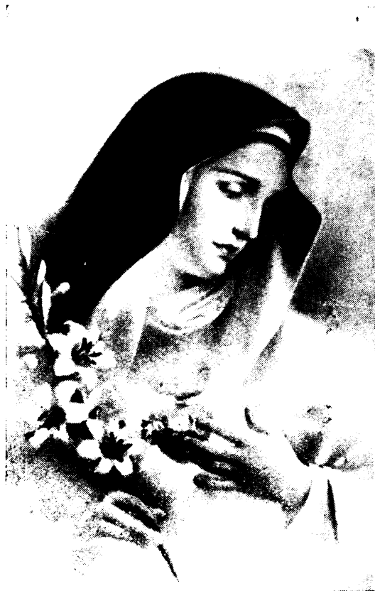
A máriabesnyői zarándoklaton a magyarországi Világi Rendet Szűz Mária Szeplőtelen Szívének ajánlottuk.

Minden társadalmi, de kivált vallásos egyesületet szeretettel kritizálnak a kívülállók. Itéletüket rendesen a gyengeségekből és a hiányokból formálják, míg a jót és a nemeset teljesen