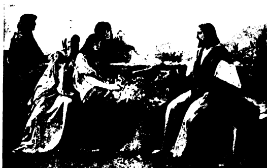
Lélek az Isten, és azoknak, akik Őt imádják, léleekben és igazságban kell imádniok. (Ján. 4, 24.)

Valahogy így vagyunk a lélek harcával is. Itt is minden változó, semmi sem állandó a lelken és a harcra kívül. Aki jól akar harcolni, aki győzni akar, annak százszeműnek és mindent