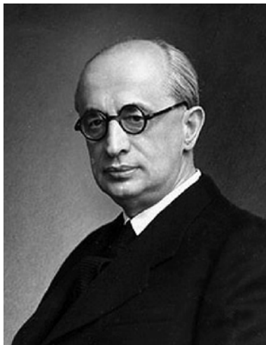
László Ravasz (1882–1975), bishop of the Reformed Church in Hungary and ministerial president of its Universal Convent and Synod