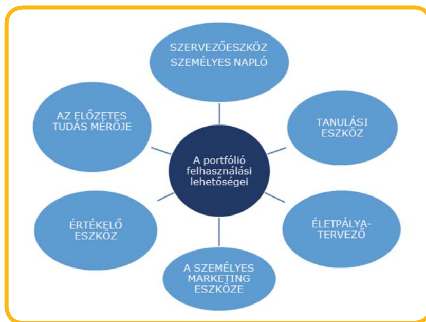
1. ábra A portfólió felhasználási területei a Career Portfolio Guide 2. oldal alapján Forrás: Lásd Irodalomjegyzék 2.

A következő ábra a szakmai portfólió felhaszná- lási területeit mutatja be: