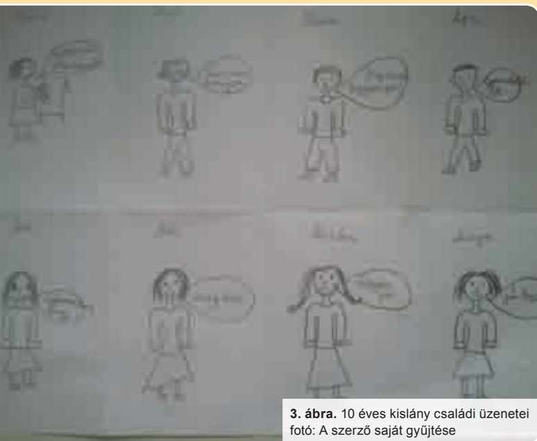
3. ábra. 10 éves kislány családi üzenetei

Nehézséget jelenthet azonban az időigény, a hosszabb konzultációs ülés szükségessége.