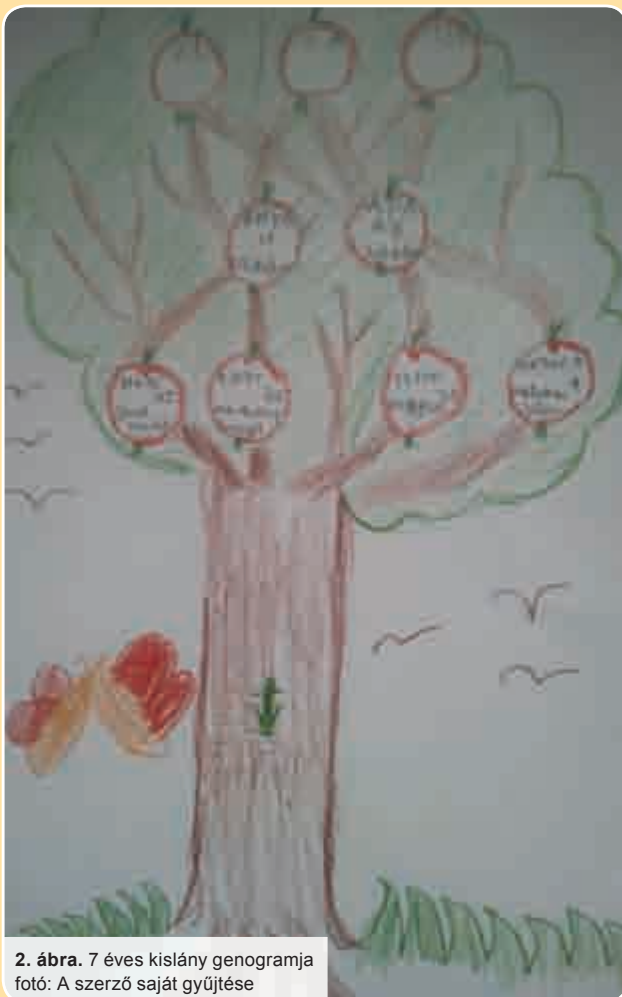
2. ábra. 7 éves kislány genogramja

Érkezhet a kliens kisebb vagy nagyobb családból, ahol eltérő lehet a családtagok száma, de három generáció általában még jól áttekinthető, így a genogramban három generációval szoktunk dolgozni.