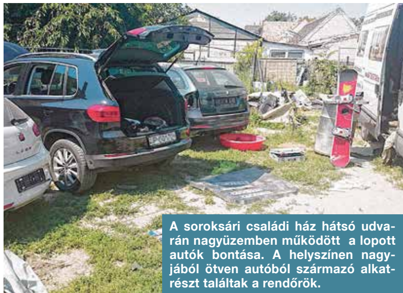
A soroksári családi ház hátsó udvarán nagyüzemben működött a lopott autók bontása. A helyszínen nagyjából ötven autóból származó alkatrészt találtak a rendőrök.

Állampolgári bejelentésre ellenőrizte a rendőrség az ingatlant, ahol öt, még egyben lévő, a Volkswagen-csoport által gyártott márkájú autót találtak, két Skoda Octaviát, egy Seatot, egy Volkswagen Tiguant, valamint egy Iveco dobozos kisteherautót.