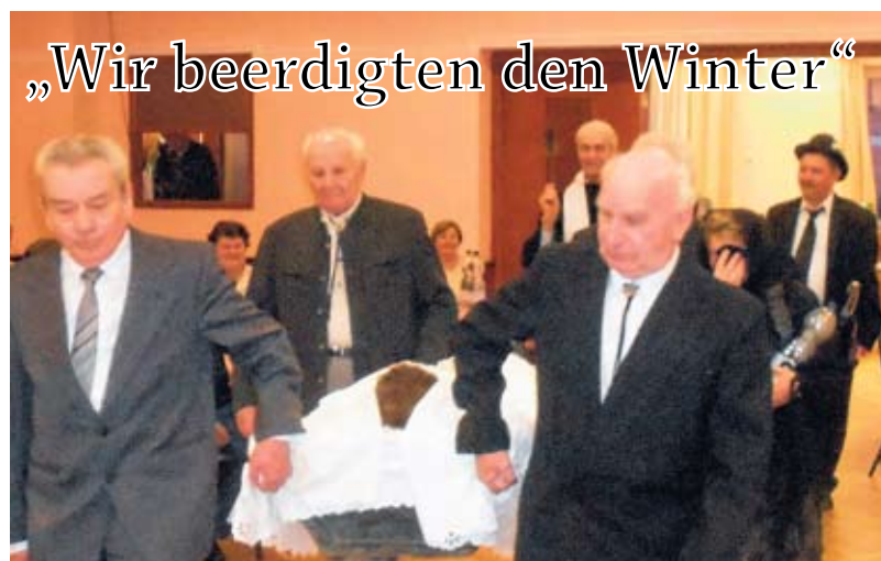
„Wir beerdigten den Winter“

Die Zeit der Narrheiten, der Fasching ist vorbei. Ein wichtiger Bestandteil des Faschingsbrauchtums ist das Faschingsbegraben. Der Fastnachtsdienstag bildet den Abschluss der närrischen Tage. Am Fastnachtsdienstag wird noch einmal gefeiert. Fastnachtsabschlussbräuche gab und gibt es vor allem dort, wo eine Symbolfigur der Fastnacht existiert. Diese wird daher öffentlich verbrannt oder in einer "feierlichen" Zeremonie zu Grabe getragen. Die Fastnächter und Narren tragen dabei häufig ein äußeres