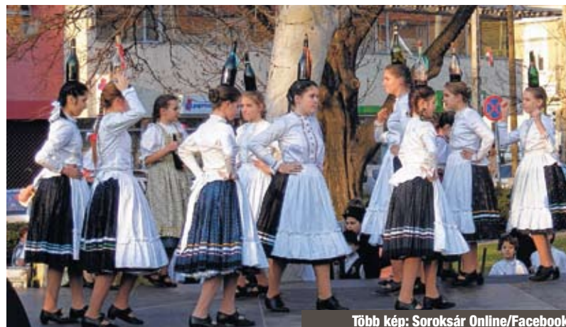
Több kép: Soroksár Online/Facebook