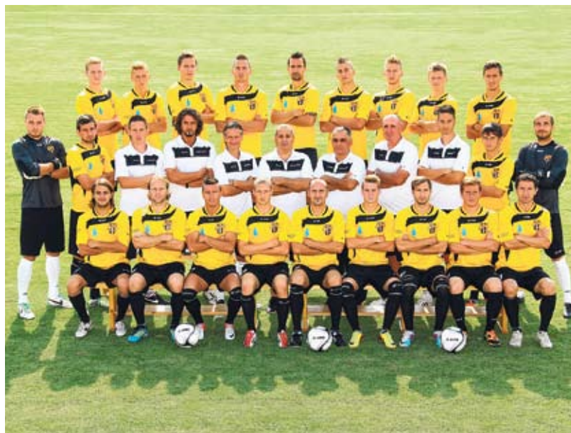
ESMTK – Soroksár SC 0:2

A Soroksár SC felnőtt csapata 20 forduló után ötpontos előnnyel vezeti a tabellát a Szeged előtt az NB III Közép-csoportjában. Az első négy tavaszi mérkőzésből három győzelmet és egy vereséget ért el a csapat.