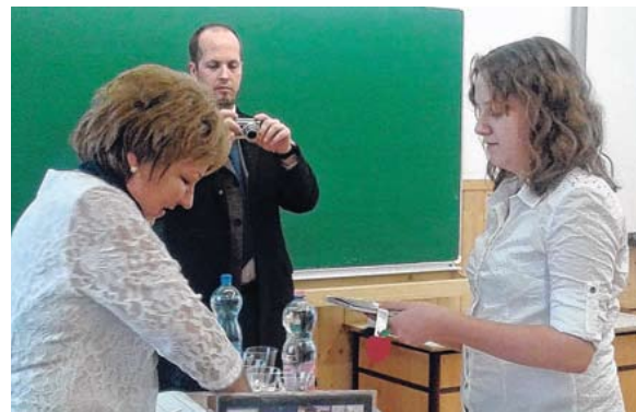
Külondíjat kapott a szép magyar beszédért