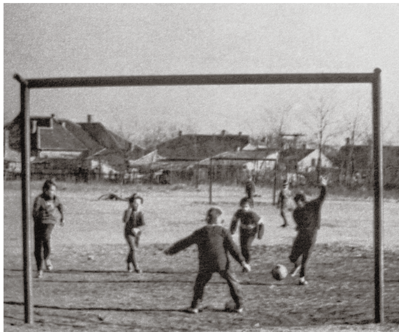
A grund a Hrivnák Pál utca és a Maros utca között