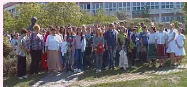
Közös fotó az erdélyi testvériskola tanulóival

Erdélyi utazáson vettek részt a Török Flóris Általános Iskola hetedikesei és az őket kísérő tanárok. Utazásukhoz jelentős anyagi támogatást nyertek a Bethlen Gábor Alapkezelő Zrt. Határtalanul! pályázatán.