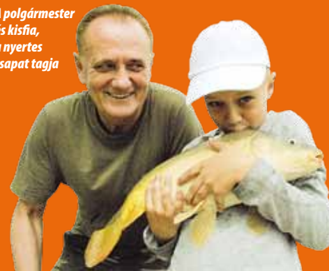
A polgármester és kislfia, a nyertes csapat tagja

A díjak között volt gumicsizma, az éjszakai horgászatához használatos fejlámpa, a Pro-Terminál horgászbottok és orsókat ajánlott fel. J.Á.