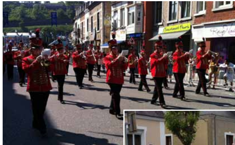
A belgiami turné pillanatképei

A Galambos János AMI fúvószenekara – kiegészítve a Pesterzsébeti Városi Fúvószenekarral – május végén koncertkörúton járt Franciaországban és Belgiumban.