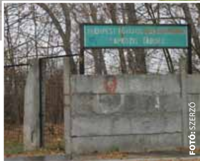
A táborra szebb jövő vár

- Ugyancsak fontos feladat a Ráckevei-Soroksári-Duna-ág rehabilitációja, ami uniós pályázat keretében valósulhat meg. Az RSD Parti Sáv projekt két eleméről (kotrás, a tisztított szennyvizek átvezetése a nagy Dunába) még mindig nincs végleges döntés, az azonban tény, hogy a Molnár-sziget üdülőingatlanjai-