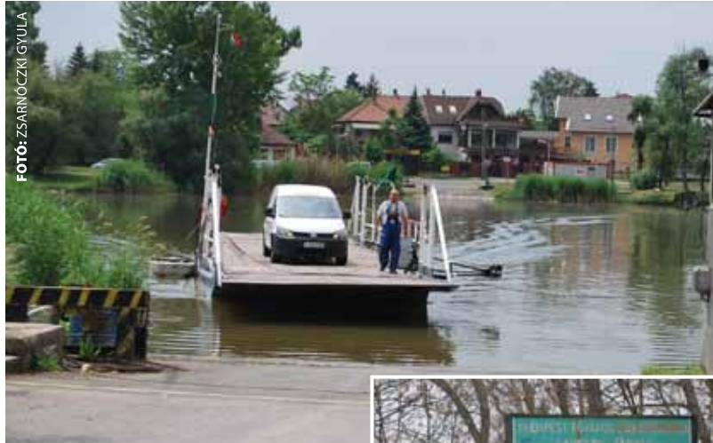
A komp maradna

nak csatornázása is az RSD Parti Sáv projekt keretében valósulhat meg. A sziget középső részén elterülő mezőgazdasági terület üdülővezeték alakítása is szerepel az akcióterület fejlesztési elképzelései között, ennek azonban előfeltétele az infrastruktúra, a közművesítés fejlesztése.