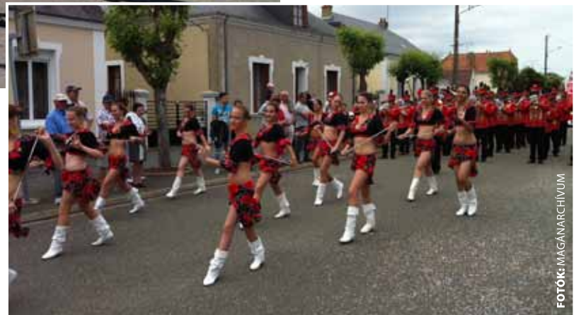
Franciaországban is nagy sikert arattak a soroksári fúvósok

– A sajátos zenekari hangzás hamar népszerűvé tette a magyar fúvó-