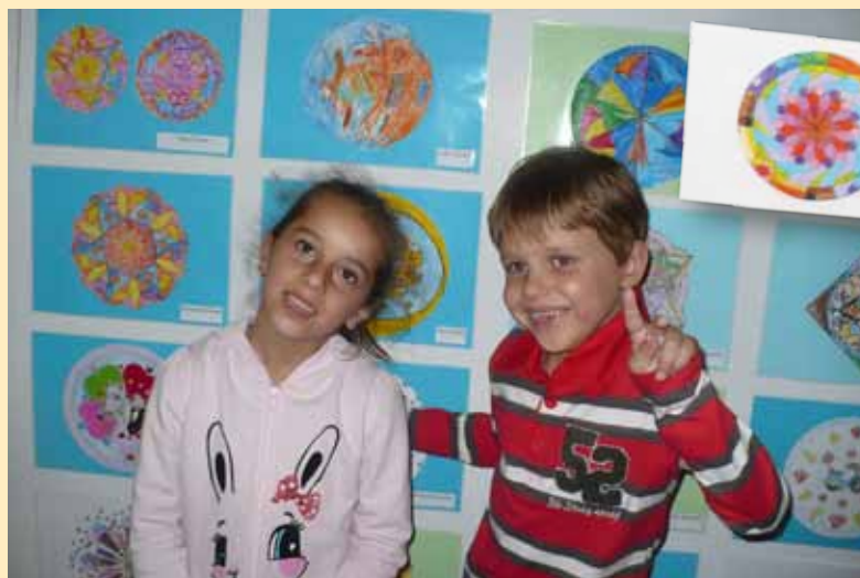
Az ovis alkotók büszkén pózoltak műveik előtt

A mandalák közös pontja, hogy alapja kör alakzat, általában szimmetrikus, vagy visszatérő motívumok adják a mintát, ám ez sem kőbe vésett szabály.