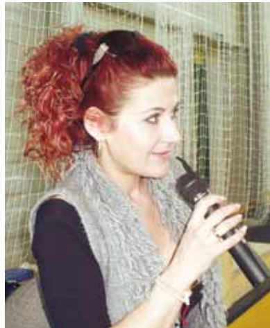
A Mozdulj Soroksár! rendezvényen is konferált