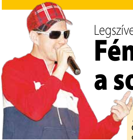
Fluor Tomi meglepetésvendég a fiatalok kedvence

A Kiscsillag Tehetségkutató verseny döntőjében hibátlan műsorokat látott a zsűri és a tehetségeknek szurkoló közönség. A rendezvény sztárvendége Fluor Tomi volt.