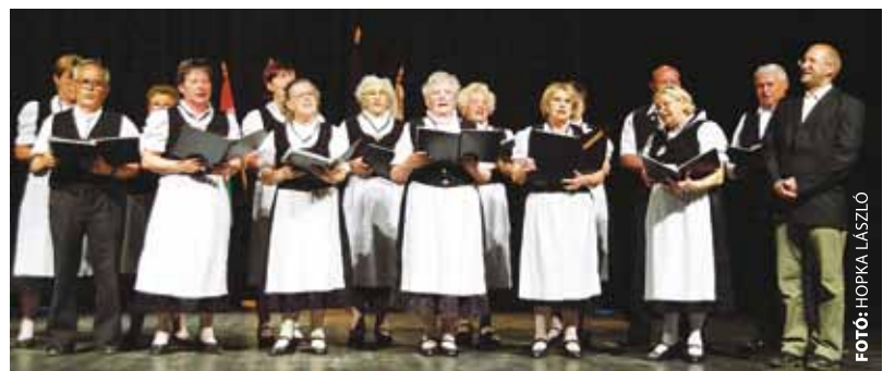
Soroksári Hagymányörző Vegyes Dalkör

A törökbálinti Munkácsy Mihály Múvelődési Házban a soroksári mű-