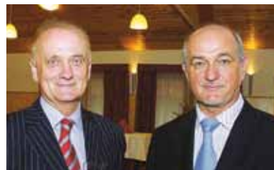
Geiger Ferenc és Turai István polgármesterek

Törökbálinton testvérvárosi találkozón mutatkoztak be Soroksár művészeti életének szereplői. A 2008-ban megkötött testvérvárosi kapcsolatot a két település sváb identitása is alátámasztja – mondta Soroksár kultúráért felelős alpolgármestere, Egresi Antal a találkozó alkalmával.