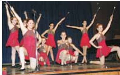
A Trambulin csoport majoretettjei