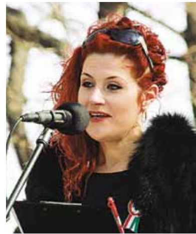
Március 15-én ő mutatta be az előadókat

– Meggyőződésem, nem lehet mindenkiből élsportoló, de lehet,