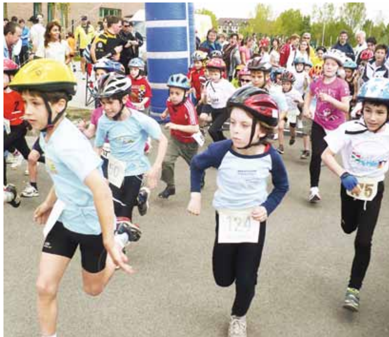
A legifjabbak is komoly elszántsággal indultak a versenynek

A XV. Sori Duetlon Verseny és Terepfesztivál idén az I. Soroksári Félmaratonnal bővült és új helyszínen, a sportcsarnokban és környékén zajlott. Óvodástól a szépkorúig tucatnyian mérték össze felkészültségüket.