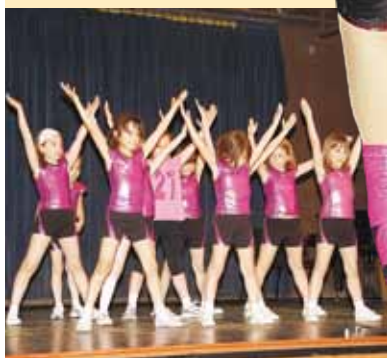
A „Rózsaszín cukik” aerobicoztak