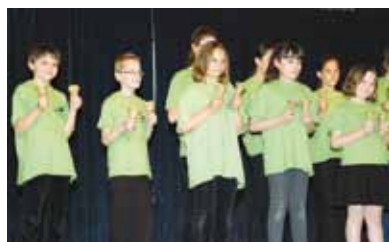
A „Giling-galang” csengettyűzenekar

A Kiscsillag Tehetségkutató verseny döntőjében hibátlan műsorokat látott a zsűri és a tehetségeknek szurkoló közönség. A rendezvény sztárvendége Fluor Tomi volt.