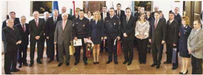
Az ünnepség vendégei, díjazottjai, jutalmazottjai

A Rendőrség Napját április 24-hez, Szent György-napjához kapcsolódóan rendezik meg. Ebből az alkalomból nyújtották át a Sárkányölő Szent György-díjakat és jutalmakat a XX.-XXIII. kerület Rendőrkapitányság legkiválóbb dolgozóinak, a rendőrség munkáját támogatóknak – idén Pesterzsébeten.