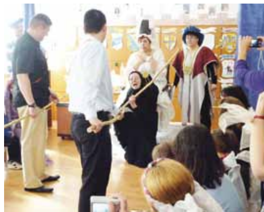
Volt boszorkányüldözés, lovagkori tánc és vásár is

Lovagvárrá alakult az I. sz. Összevont Óvoda Rézöntő utcai tagintézménye. Az óvoda valamennyi dolgozója, szülők és gyermekek lovagkori öltözetben töltötték a családi hét zárónapját.