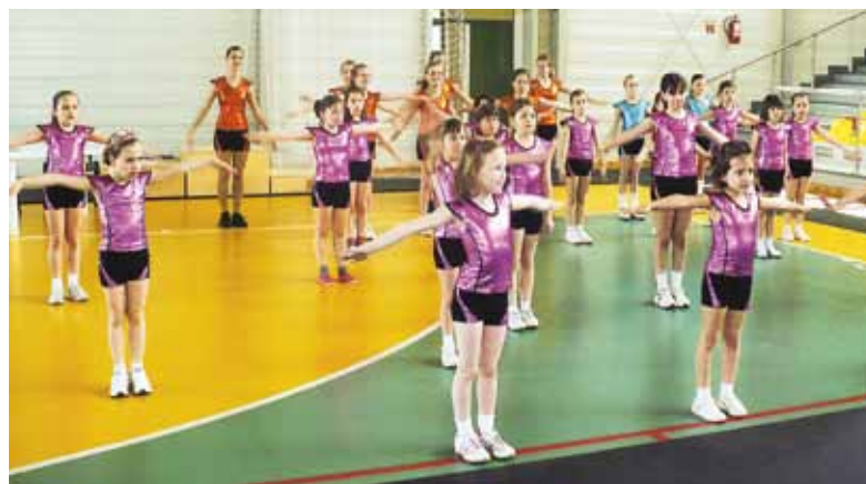
Az aerobikos lányok díjnyertesek