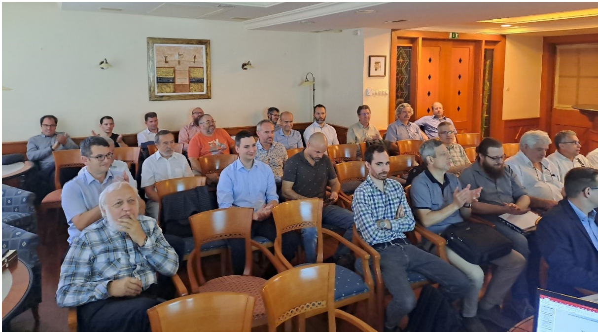
1. ábra: MAÚT-vitanap résztvevői a Makadám Klubban.