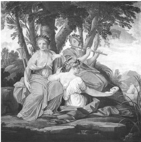
Kleio, Eutherpé és Thaleia

„A szépség igazság” mondták a görögök, s a Múzsák létezése ezt igazolni látszik.