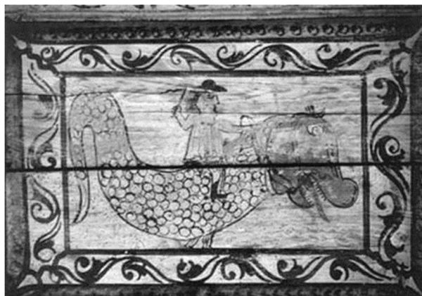
Sarkányon lovagló garabonciás (templomi kazetta, Técső)

Az amerikai törzsi népek hitvilága és mitológiája csodálatos gazdagsággal vetíti elénk a világmindenséget és annak mesélő képzetvilágát. A mindenséget a Pókasszony hálójába szövédvé látják. A magyar népköltészetben is találunk hasonló képzetet.