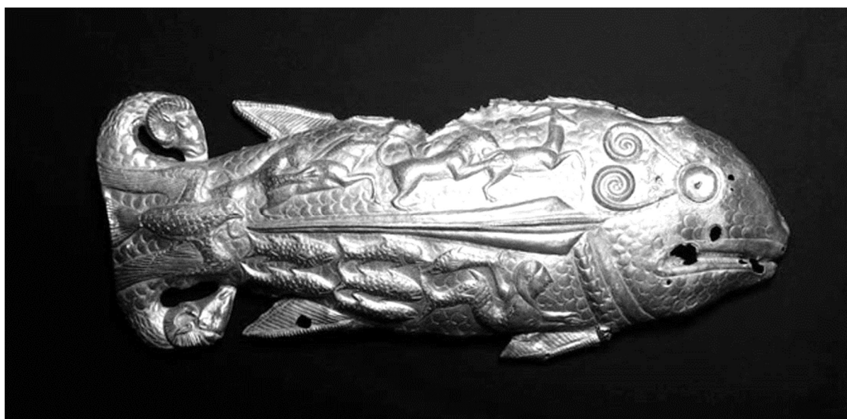
Székita aranykincs