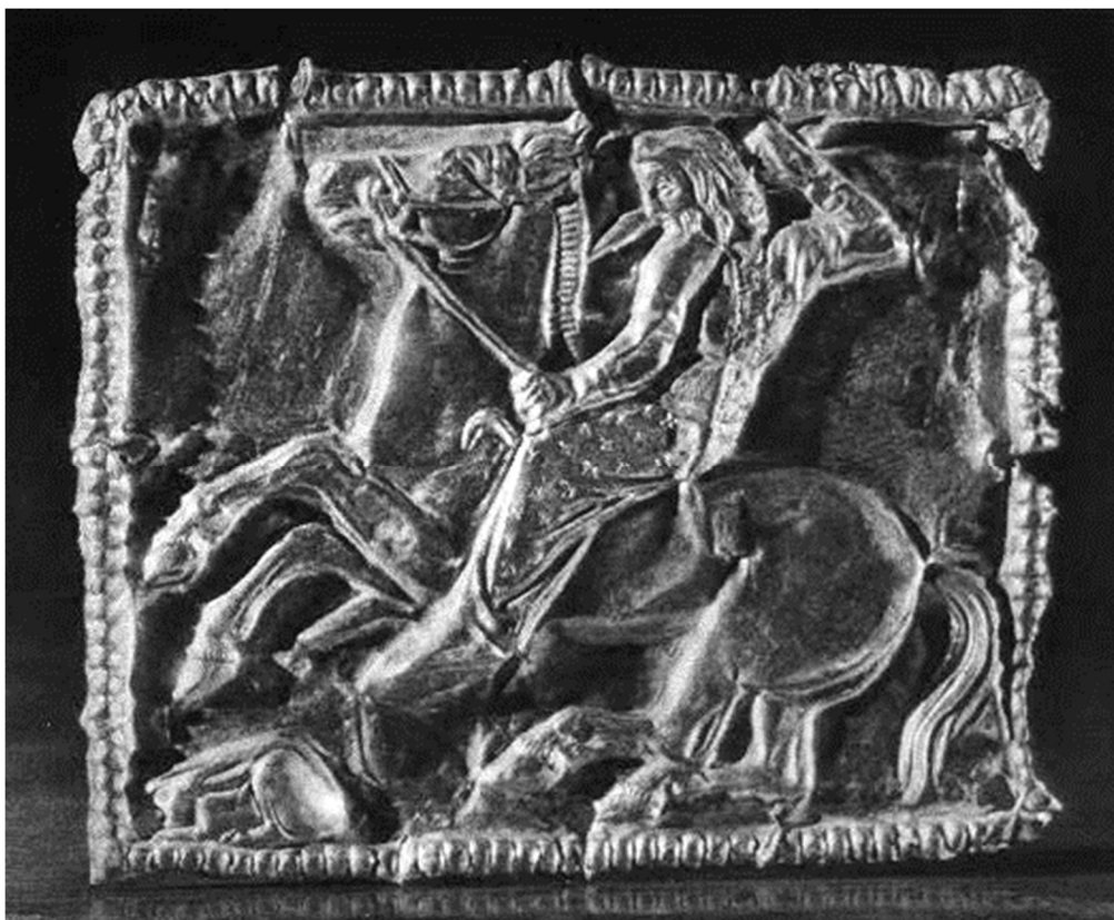
Székelyi aranykincs

Lehet, és kell még olyan történelmet írni, melyért a fiatalok is lelkesedni tudnak, nem másként, csak az igazság teljes leírásával. Ha történelmi tudatunk a lényeg ismeretére épül, újra a hősdalok szellemében és erejéből, akkor megmaradunk.