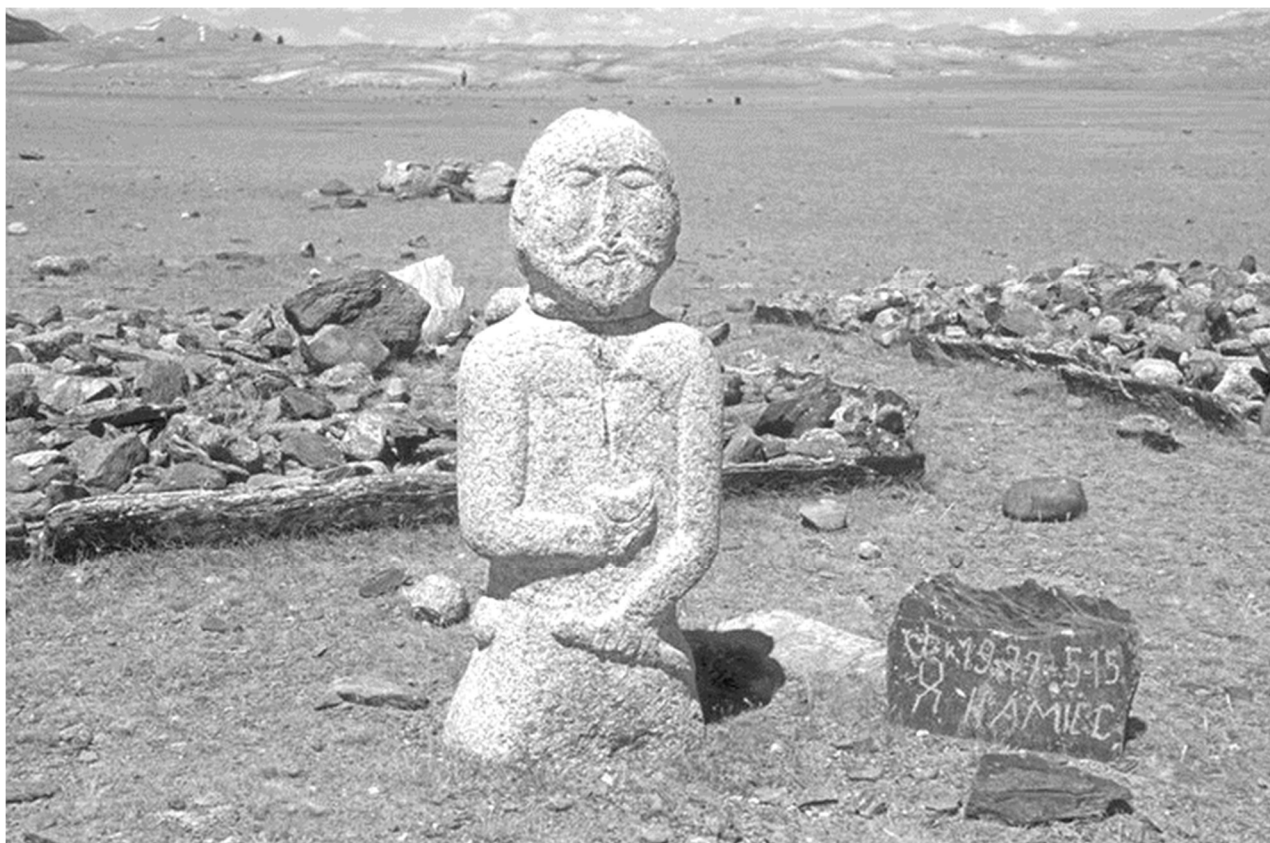
Mongol sztyeppe-i kőfaragás (kun-baba), mely utal a vérszerződés ritualitására