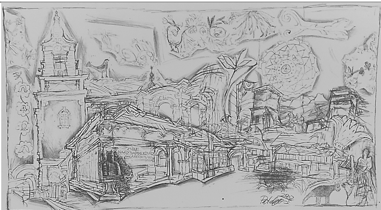
Álomkép az iskoláról (Pataki János rajza)