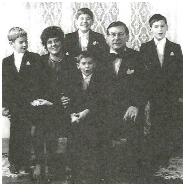
A Buzády-család Münchenben (1985)