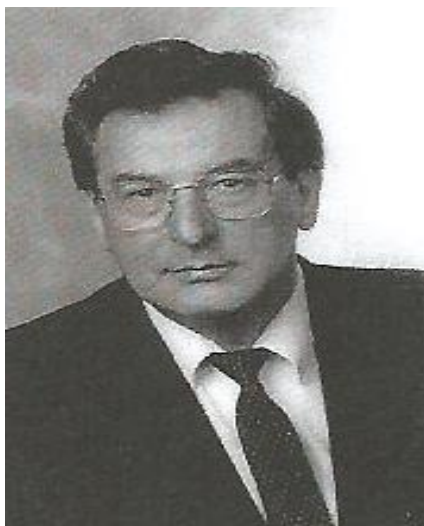
Buzády, az ifjú orvos (1962)

Ötvenhatért tisztelték, szerették az angolok a magyarokat, ösztöndíjat adtak a diákoknak. Az egyik egyetem rektora elhatározta, hogy felvesz tíz képzés alatt álló menekült medikust, és ingyen kitaníttatja őket.