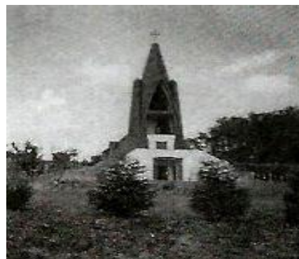
„Exegi monumentum...” Kilátót építettem Letenyén