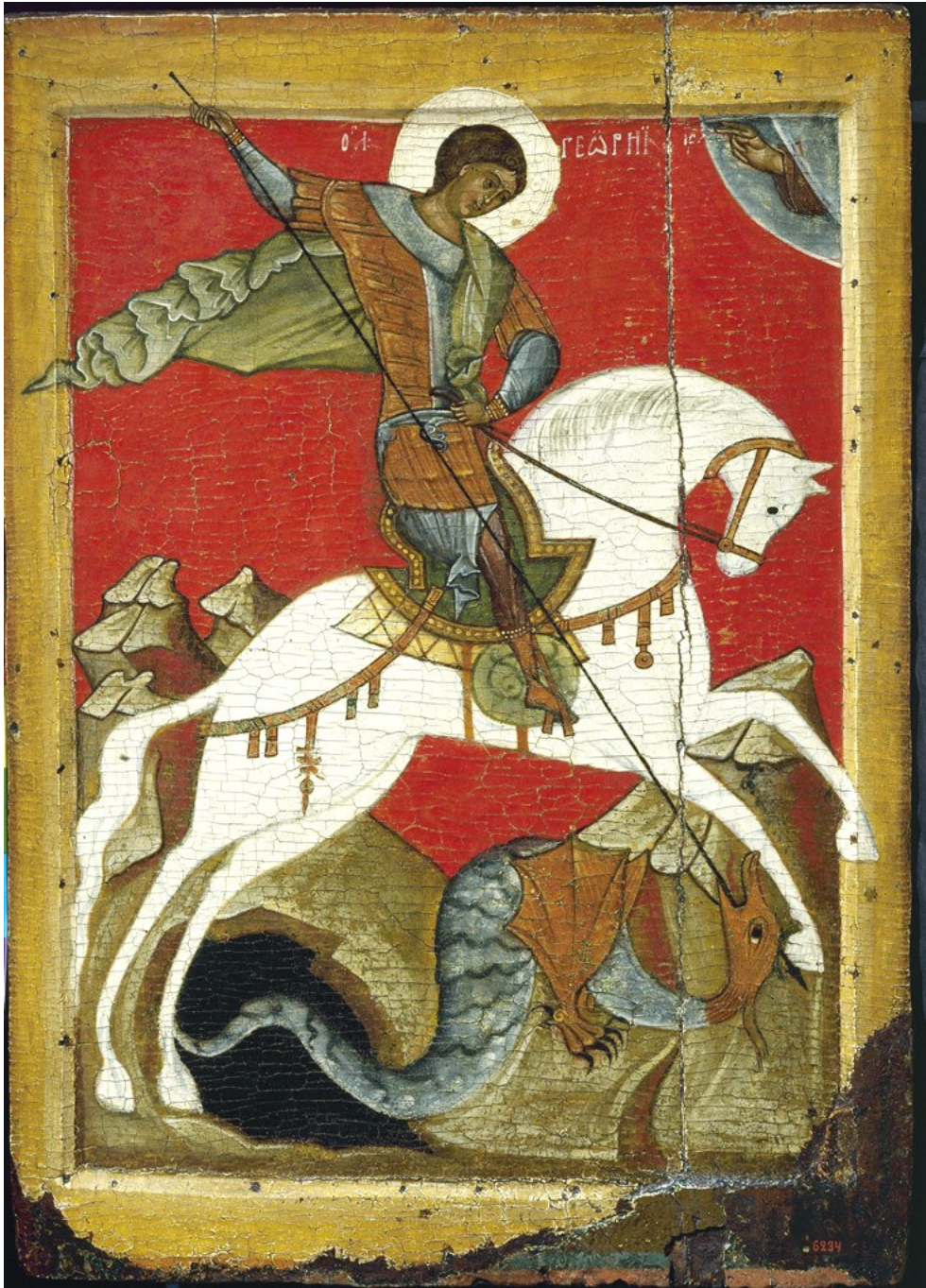
Sárkányölő Szent György-ikon Novgorodból (XV. század) ismeretlen szerző