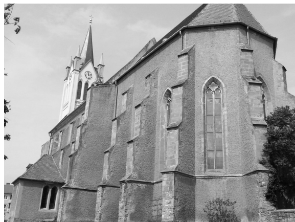
Keszthelyi ferences templom

Ez esetben is a királyhoz, mint birtokadományozó személyhez fűződő elkötelezettség nyilvánulhat meg a tájolási szándék mögött.