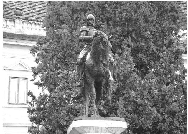
Lackfi II. István

a várak adományozására eddig külön oklevél nem került elő, úgy gondolták Muraköz mellett Keszthely is ekkor jutott a család kezére. A Lackfiak általi birtoklás első hiteles említése 1378-ból való. Viszont a ferences rend keszthelyi jelenlétének első írásos nyoma 1368-ból származik. Ezek értelmében, 1368-ban, a ferencesek említésekor még Anjou Nagy Lajos király lehetett Keszthely földesura. Vagyis a rend meghívása és letelepítése a király személyéhez köthető! Ebből az is következik, hogy a templom alapítása és építésének kezdete Nagy Lajos nevéhez fűződik és Lackfi a király szándékai szerint csak folytatta az építkezést. 46 A logikus következtetésnek egy adat mond ellent. Állítólag a templom falán a XVIII. században még olvasható volt egy — valószínűleg utólagos — felirat, mely arról tudósított, hogy az egyházat Lackfi fogadalomból építtette. A fogadalomról és a felirat eredetéről részletek nem ismertek. 47