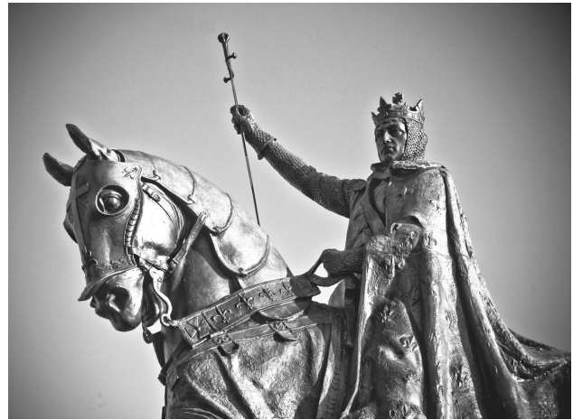
IX. Szent Lajos lovag