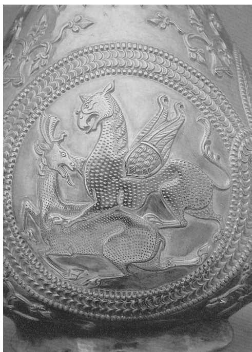
1. Maros és a Hold. Részlet a nagyszentmiklósi kincs 2. számú korszójáról (3. sz.)

Az ókori görögök által szkítának nevezett székely ősök, akik lenyűgöző műalkotásaikban a stilizálás, a torzítás és az ötletesség mesterei voltak, előszeretettel ábrázolták a Holdat „maró” Napot jelképes formában.