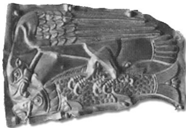
4. Halat (fogyó Holdat) markoló napmadár. Szkíta díszlemez i. e. 450 körül