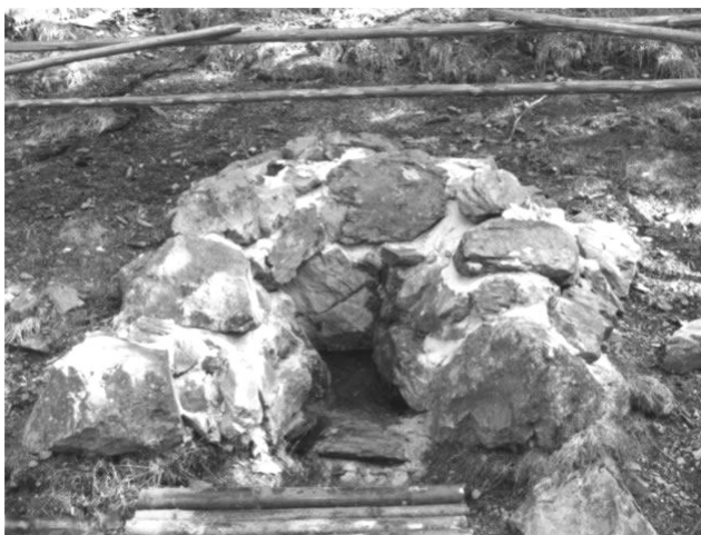
6. A Maros igazi, földrajzi forrása, a Fekete-rezben

Mivel a felkelő Nap magánhangzói az é és a rövid o , ezért a maros eredeti formája a mérész (merész?) és a morosz lehetett.