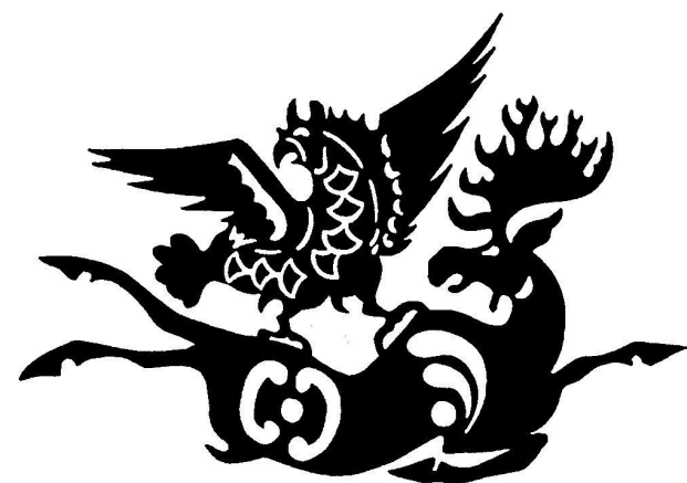
2. Jávorbikát markoló griff. Paziriki szaka nemezzátét, i. e. 5-4. sz.