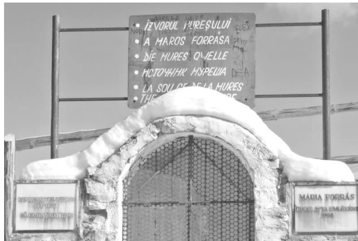
5. A "turisztikai" forrás, a tábla szerint a Mária forrás

Talán nem délibábos kísérlet Mária nevében felfedezni a Nap mar szógyökét, hiszen a napba-öltözött Boldogasszony elmaradhatatlan kísérője a holdsarló. Ez esetben a Maros forrását akár Mária-forrásnak is nevezhetjük.