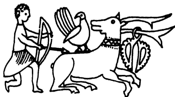
3. Az újhold (nyilas), Nap (griff), fogyó Hold (szarvas) hármassábrázolása a jászberényi Lehel kőről. A nyíl nem üthet sebet az állatban.