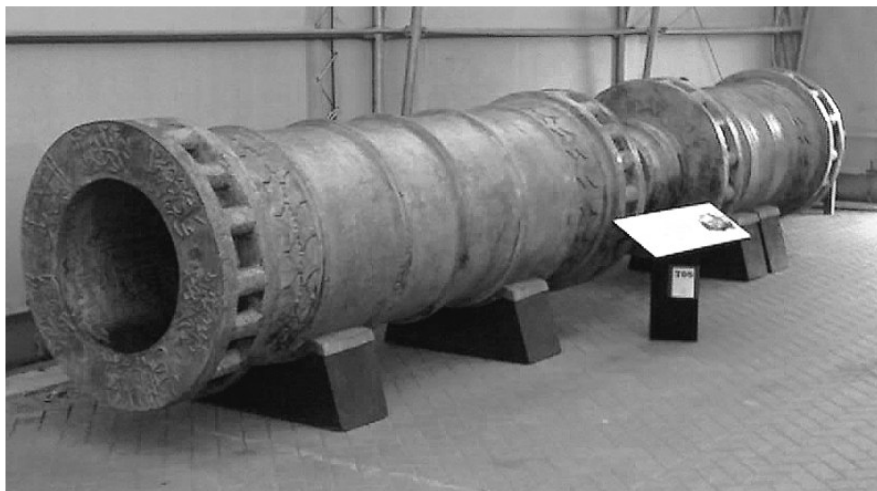
Orbán mester tulipános ágyúja Konstantinápolyban

Beder Tibor kutatásai szerint Orbán mester felajánlotta tüzérségi tudását a konstantinápolyi császári udvarban, alkalmazása helyett inkább tömlöche vetették. Az első konstantinápolyi sikertelen török ostrom után szerzett tudomást II. Murád szultán a magyar ágyú-öntőről. A szultán egy „török kommandó” felállításával kiszabadította a mestert, és „hadmérnökként” személyesen fogadta: megbízta a világ legnagyobb ágyújának kiöntésével. Ez lesz a Basilika/Dardanella úgyú . Egy példány, a Sahi ma is látható Isztambulban (Katonai Múzeum), egy másik pedig az Egyesült Királyságban.