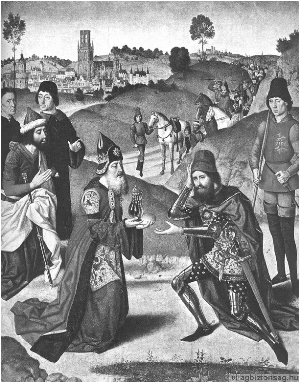
Ábram és Melkizedek találkozása, c. 1465

legenda szerint Melchisedek Jeruzsálem alapítója volt és a város királyai az ő utódainak számítottak.” 1