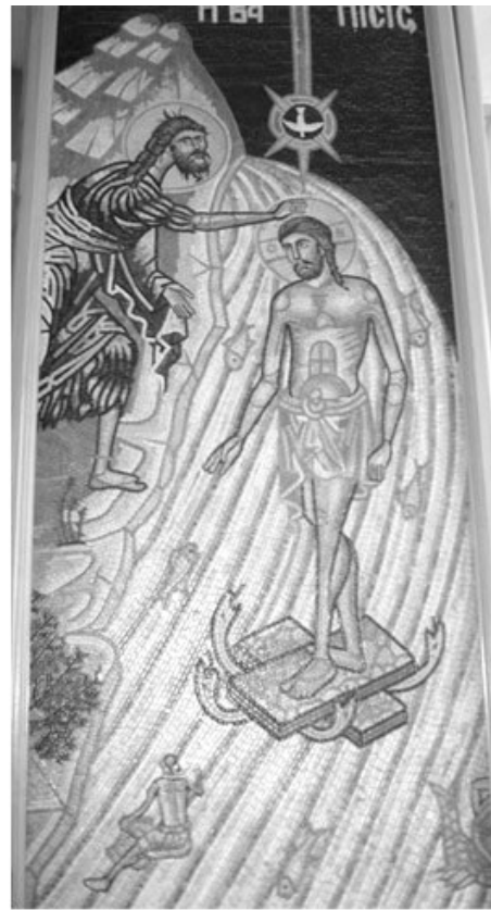
A kígyó védő szerepe régi képeken