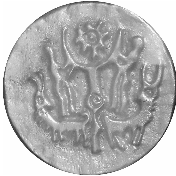
Nap pályáját őrző hegyikecskék DILMUN SEAL 2500 BC - 500 BC