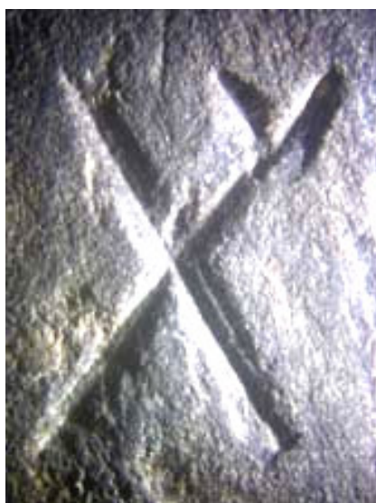
A kampós X a rúna kővön

1876-ban Amerikában egy telepes, Olof Ohman Kensingtonban földmunkálatok végzése közben rátalált egy ősinék látszó faragott kőre, amelyet Kensington kőnek neveznek. A jelekben a skandináv ősi rúnákat vélték felfedezni, kivéve egyet, az ún kampós X-et, amelyet nem ismertek a vikingek.