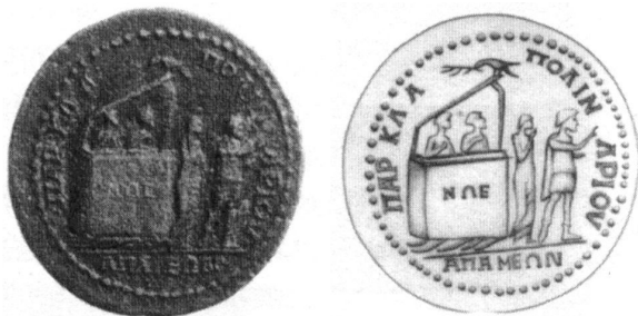
75. Noé és a felesége a bárkában és a szárazon A bárka felirata: NOÉ

Forrás: Marton Veronika: Világkatasztrófák (Matrona, Győr, 2011, 98. o.)