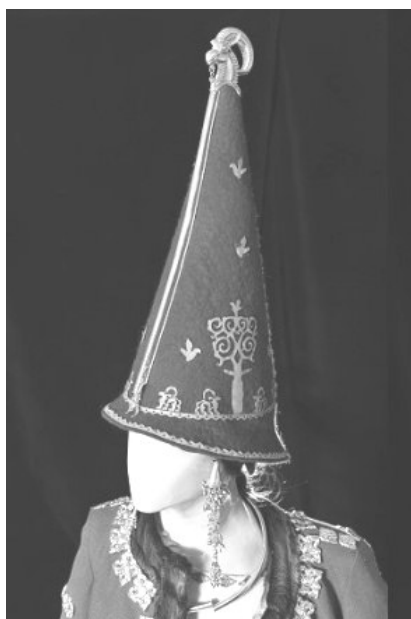
Az Arany Hercegnő (Kazahsztán)

Ízisztől korábban Inannával (Ím-Anna) találkozunk, aki megnyitja méhét, hogy szerelmétől megfogjon, tehát szerelemben átélt istennői koncepció. Szabadon szeret, ő dönt teste és termékenysége felett, s ő hívja magához választottját. Egy UR városában talált ékiratos táblán olvasható vers Inanna szerelmi találkozásjáról regél. Így kezdődik a vers: „ Inanna fejére helyezte a sztyeppék koronáját... ” majd hívja Dumuzt, hogy szeresse őt. Hátát egy (gránát) almafának támasztja és megnyitja szeméremdombja barlangját.