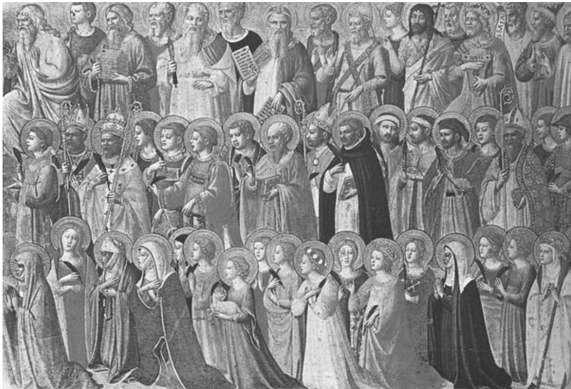
Fra Angelico festménye

A keresztény szentek tisztelete már a II. században megkezdődött.