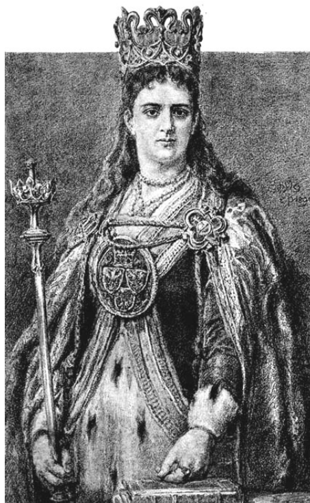
Anjou Szent Hedvig

Anjou Nagy Lajos magyar király és Kotromanic Erzsébet kisebbik leánya, Lengyelország királynője, 1384-ben koronázták meg.