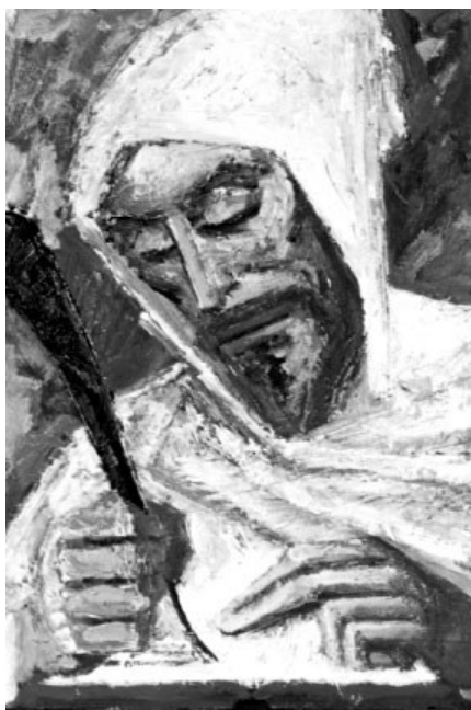
Boldog Báthory László