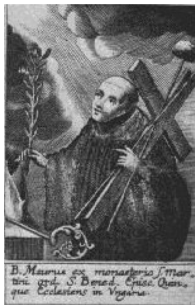
Szent Pécsi Mór

1063-ban Szekszárdon Mór temette el I. Béla királyt.