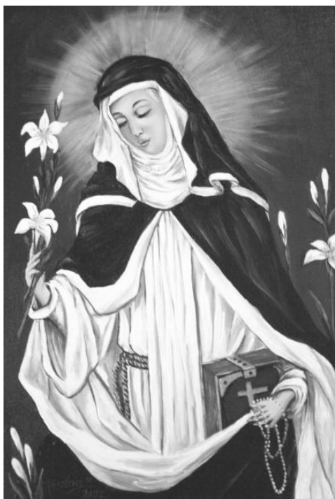
Árpád-házi Szent Margit

Isten rabjai címen 1908-ban írta meg feledhetetlen regényét Margitról.