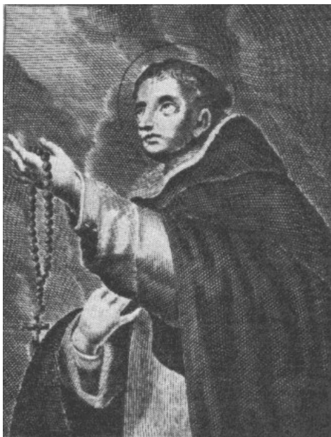
Boldog Csák Móric

A legenda szerint a házastársak három év után mindketten kolostorba vonultak. (Móric a budai, Katalin a Margit-szigeti domonkos kolostorokba.) Mivel Móric birtokairól nem rendelkezett, ezért az apósa bezáratta a budai monostor tornyába. Mivel a házastársak nem változtatták meg szándékukat, a nádor félévi elzárás után Móricot szabadon engedte. Móric ezt követően Bolognába utazott, majd ezt követően egész életét az ország különböző domonkos kolostoraiban élte le.