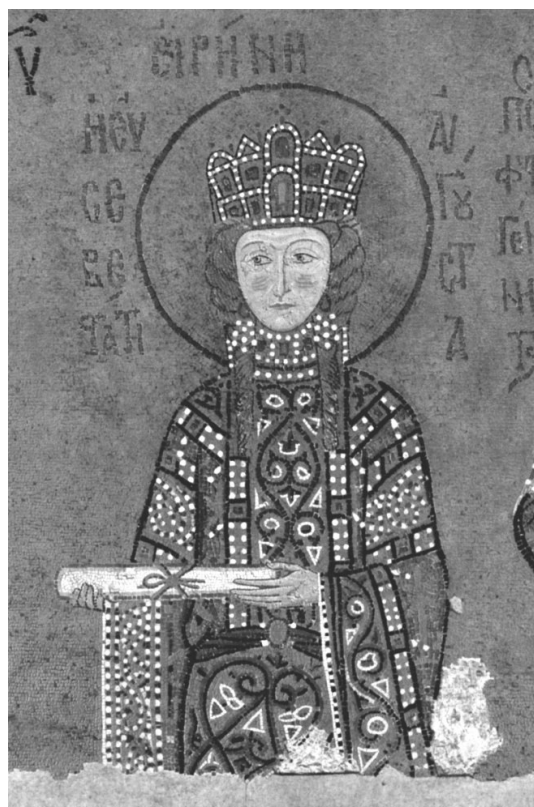
Árpád-házi Szent Piroska

kította meg kapcsolatát és hűséges maradt egész életében, méltón egy Árpád-házi királyleányhoz. Szent László leánya nagyszerű és tehetséges császárnő lett, aki értett az államügyekhez és a gazdaság irányításához. Nyolc gyermeke született János császártól. Legidősebb fia I. Manuel császár néven Bizánc egyik legjelentősebb császára lett.