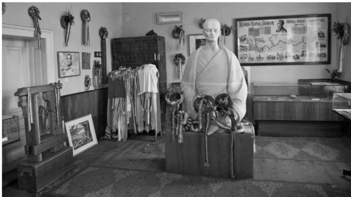
Csomakőrösön a Körösi Csoma Sándor emlékszoba

Azt hiszem, vendégeink sem felejtik el egyhamar... Abban a reményben, hogy az országra, minden Kedves Barátunkra Isten áldotta jó év vár, szeretettel küldjük karácsonyi jókívánásainkat.