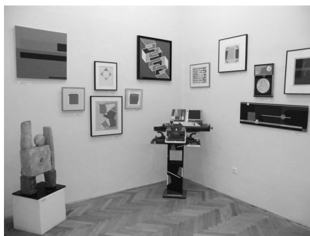
Nemzetközi Modern Múzeum, Hajdúszoboszló (Internet)

Utána 2 hetet egy szép hotelban voltunk, Hajdúszoboszlón, barátaink, Udvarhelyiek jóvoltából. Impozáns élményfürdőket építettek, sok szép park van, virágzik a város! Joseph Kádár francia festő, (azaz Kádár József) 40 év után hazatért, jelentős néprajzi gyűjteményét, s rangos párizsi festőbarátai képeit a városába hozta. Így lett egy modern nemzetközi képműkiállítás, Vásárhelyi, Hajdu, Picasso, Chagall, Dali stb. nevekkal fémjelvezve.