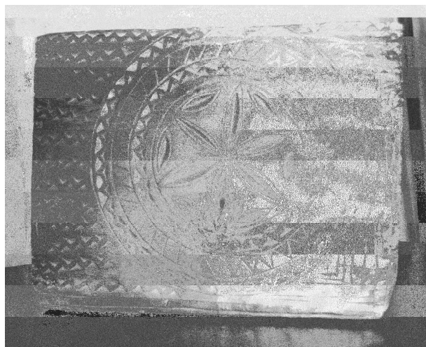
Világ-virága jelkép egy magyar rab utazóládáján Svájceban a Sion vára kiállításon