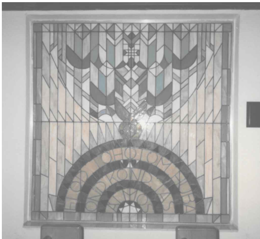
A hét vezér

100 évig nem akadt vetélytársunk Európában, mindenütt rettegték nyílainkat, s alaposan megtanulták, hogy „ne bánts a magyart!” Dicsőségünk teljes fényében ragyogott egészen István királyig. Mindenben önállóak voltunk, gondoskodtunk az öregekről s az elesettekről (árvák, özvegyek); gazdagság, béke, rend, és szeretet virágzott az egész országban. Nem volt vallási kényszer, felnégyelés vagy megvakítás, senkit se döntöttek jobbágyosorba, a vezéreket mindig önvérünkből választották, rátermettségi alapon. Talán ekkor lehattünk utoljára korlátok nélküli boldogságban, tetőtől talpig magyarok!