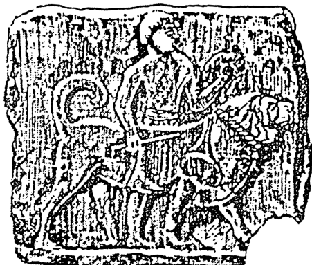
Kutyát vezető szolga Terrakotta. (London, Brit. Múzeum)

kiválóak a jelenlegi kaukázusi kutyák is. A városi ember számára védőtárs és barát a kaukázusi juhászkutya. Portáját és gazdáját is vehe­mensen védelmezi. Nagy mozgásigénye van, és érdekes módon imádja a vizet, kitartó úszó. Ví­zimentésre is alkalmas.