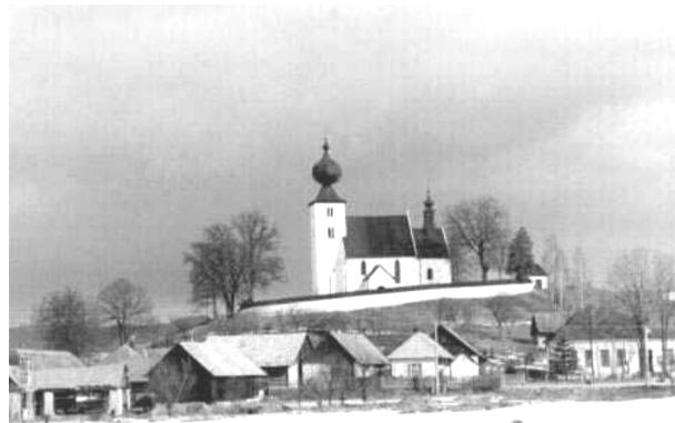
A zsigrai templom