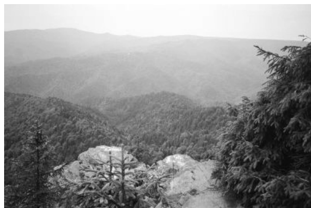
Kilátás Istenszékéről (Távolban a Havasok)