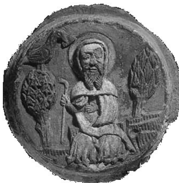
Faragott zárkó Remete Szent Pál